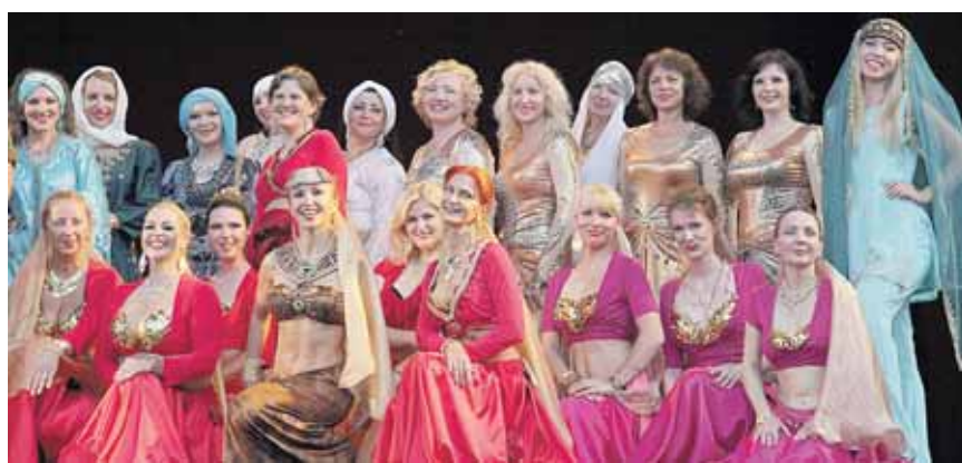
Tokių gražuolių kurortas seniai nematė

Viena didžiausių ir seniausiai Lietuvoje veikiančių rytietišku šokių studija „Orientalija“ savo naujame spektaklyje „Užburta miestas“ naudojo etninius šokius iš įvairių Artimųjų ir Vidurinių Rytų ir Afrikos regionų – Egipto, Nubijos, Afganistano, Persijos ir kt., o taip pat įvairių stilių rytietiškus pilvo šokius.