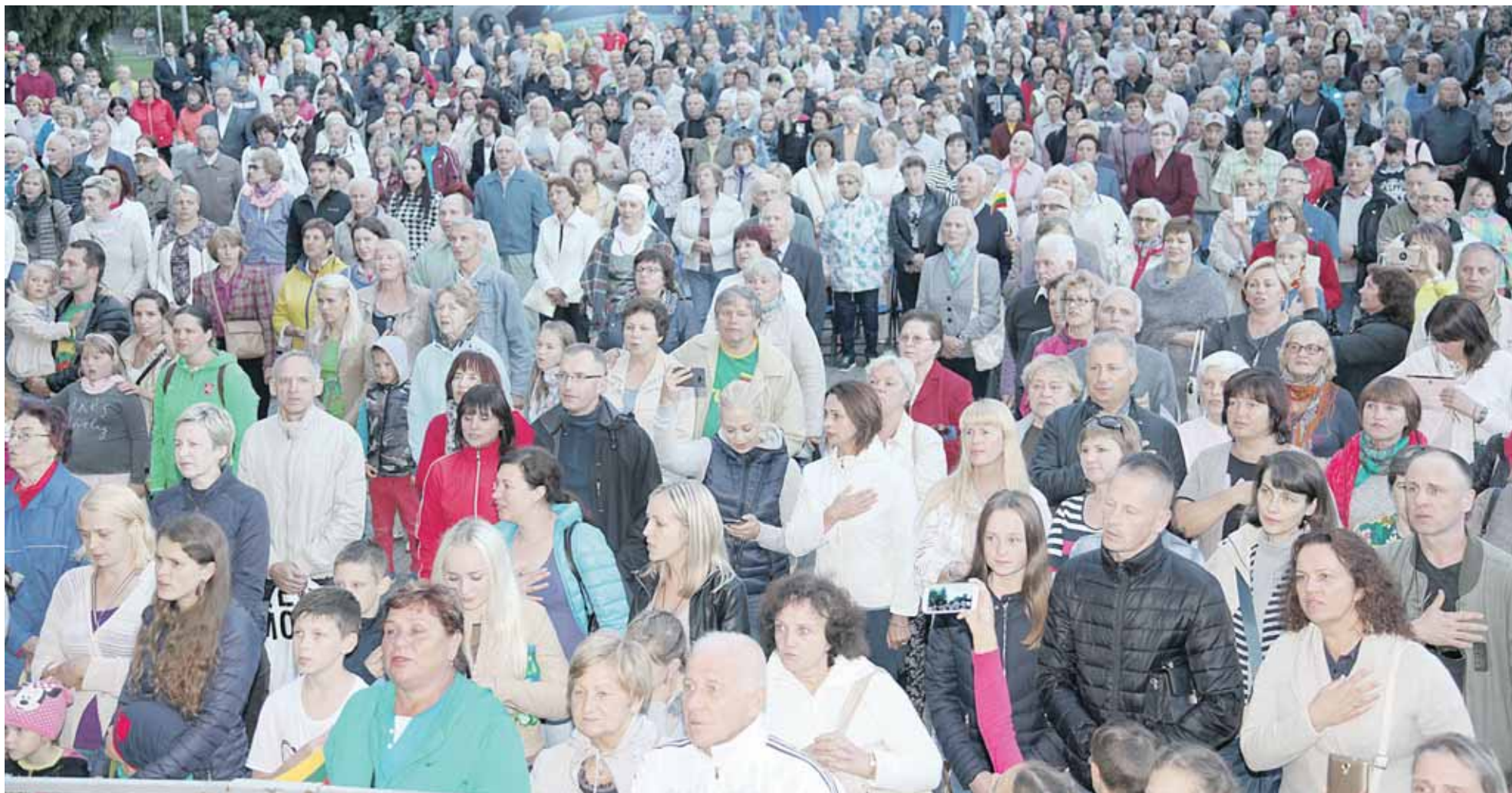
Druskininkuose „Tautišką giesmę“ giedojo rekordinis žmonių skaičius – Pramogų aikštė buvo sausakimša