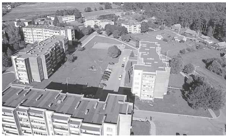
Viečiūnai nori būti miesteliu

P raėjusį penktadienį, liepos 1 d., posėdžiavę vietos politikai priėmė sprendimą gyvenamosios vietovės pavadinimą „Viečiūnų kaimas“ pakeisti į „Viečiūnų miestelis“.