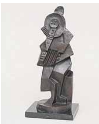
Pierrot su klarnetu