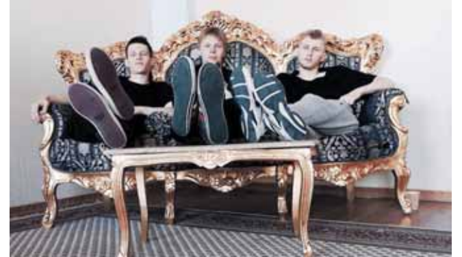
„Sheep Got Waxed“

mina. Tokia muzika kaip geri juokeliai, kurie iškart įstringa ir ilgiam išlieka. Muzika be spalvų greit pasimiršta. Trumpai tariant, muzikoje ieškau originalumo ir savitumo.