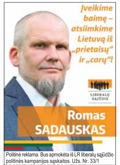
Politinė reklama. Bus apmokėta iš LR liberalų sąjūdžio politinės kampanijos sąskaitos. Užs. Nr. 33/1