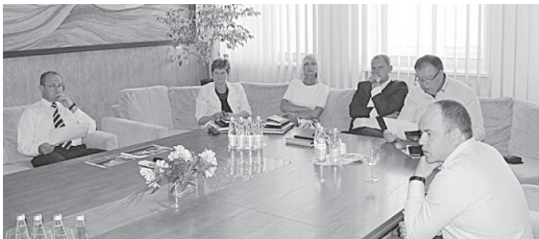
Snow arenos 5-erių metų gimtadienio paminėjimas savivaldybėje