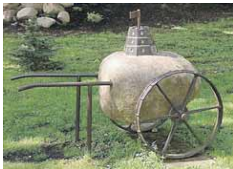
„Gedimino Mažinto pilis“ prie centro „Dainava“