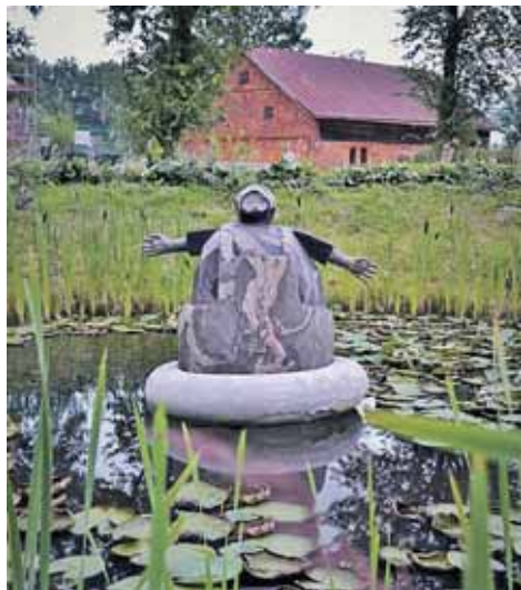
„Naras“ Zyplių dvare