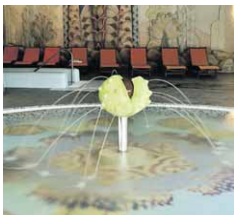
„Kaštonas“ vandens parke Druskininkuose