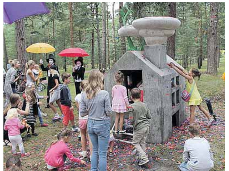
Skulptūra „Pupa“ Palangoje atidarymo dieną

Kuriu nestandartinius interjerus – jei apsilankytumėte Druskininkų, Vilniaus, Palangos vandens parkuose bei Druskininkų „Snowarenoje“, tai didžioji dalis uolų ir meninio apipavidalinimo yra mano kūriniai.