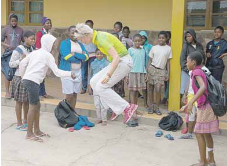
Nida su Mozambiko vaikais

- Tavo kulinarinė knyga „Izraelio skoniai. Šventės ir kasdienė“