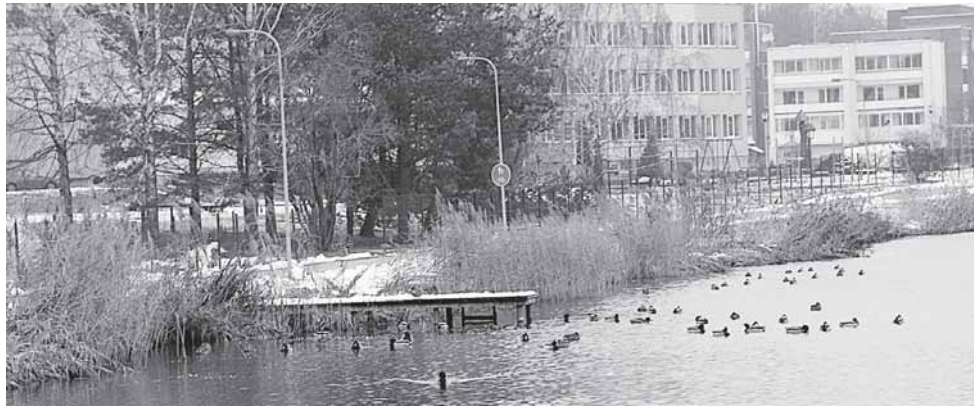
Ančių būriai iki šiolei klykauja įprastoje savo šėrykloje Vijūnelio pakrantėje