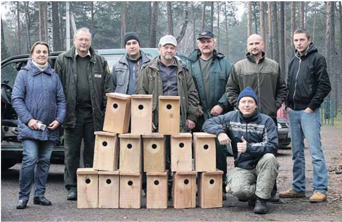
Akcijos metu Druskininkų mieste buvo iškelti net 72 inkilai, skirti juodajam čiurliui perėti

„Tikrai prasminga ir simboliška šią inkilų kėlimo akciją įgyvendinti 2016 m. pabaigoje, juolab Lietuvos ornitologų draugija (LOD) šiemet metų paukščiu paskelbė juodąjį čiurli (apus apus). Metų paukščio akcijos skelbiamos įvairiose pasaulio šalyse, jų tikslas – atkreipti visuomenės, aplinkosaugos institucijų dėmesį į paukščių rūšis, kurioms tuo metu labai reikalingas išskirtinis žmonių dėmesys ar spe-