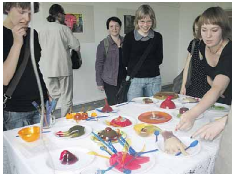
Vilniaus dailės akademijoje ginantis magistrinį darbą. Dalis jo buvo spalvotos valgomos želė figūros

- Šias „66 istorijas“ tavo iliustracijos tęsia tapybos spalvų gyvastim, aktyviu veiksmu, išmone, panašiai kaip ir kitos tavo iliustruotos knygos, tarkim, pačios parašyta ir iliustruota knygelė vaikams „Taškuota pasaka“, kur boružėlė skrenda į