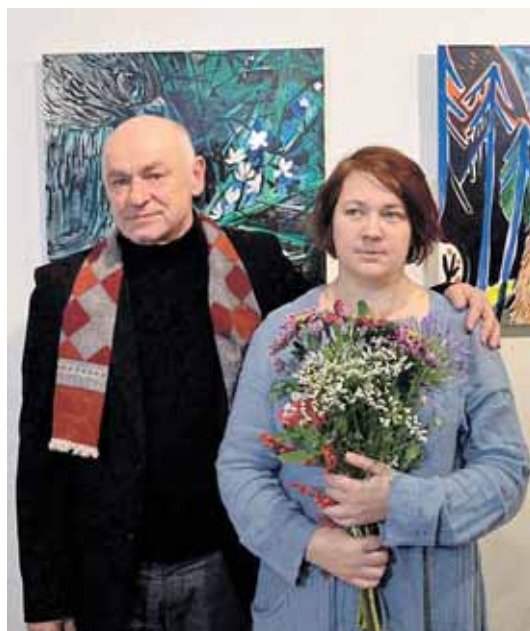
Su Andriumi Mosiejumi parodos atidaryme lapkričio 19-ąją