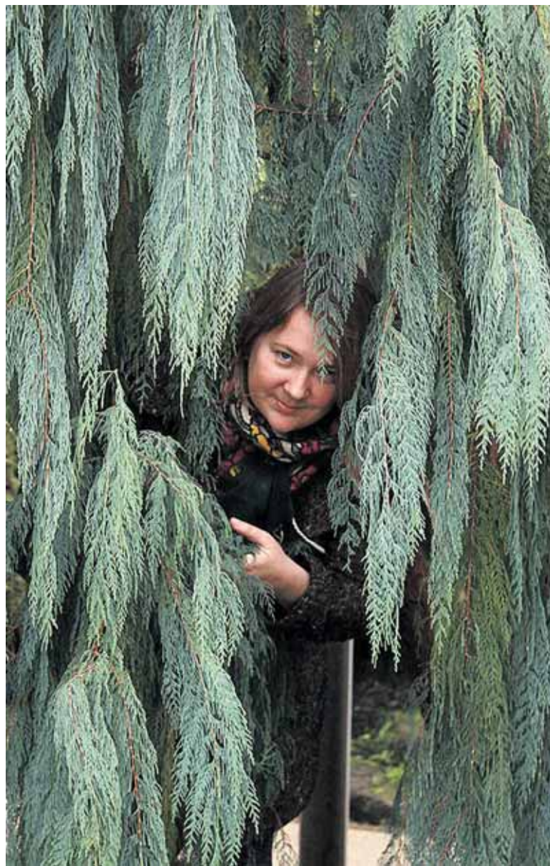
Botanikos sode Škotijoje