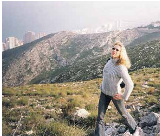
Žygyje – meditacijoje Ispanijos kalnuose