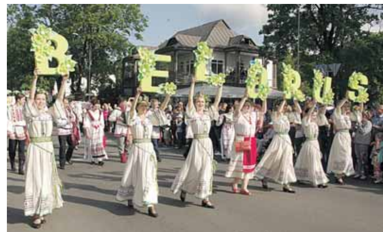
Baltarusijos valstybinio universiteto šokių ansamblis „Kryžačok“ Druskininkų kurorto šventės eisenoje praėjusiais metais