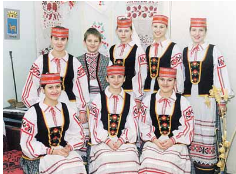
Druskininkus garsinęs vaikų vokalinis ansamblis „Spadčina“

Statistikos duomenimis, Druskininkuose gyvena daugiau nei 90 proc. lietuvių tautybės žmonių, likusieji apie 10 proc. – tautinės mažumos, iš kurių gausiausias – lenkai (apie 3,46 proc.), rusai (apie 2,72 proc.), baltarusiai (apie 1,24 proc.) ir kt. Iš vietinių tautinių mažumų lenkai susibūrę į Lietuvos lenkų sąjungos Druskininkų skyrių, o baltarusiai – į kultūros draugiją „Spadčina“ („Paveldas“), kuri jau 25-erius metus mūsų regione puoselėja savo tautiškumą.