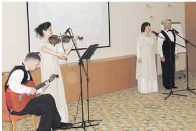
Ansamblis „Elegija“ iš Vileikos miesto atliko autorines dainas baltarusių kalba