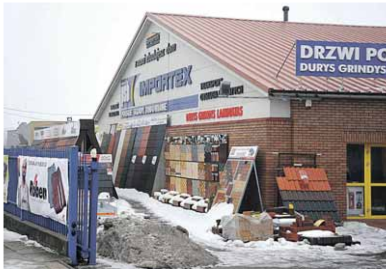
Suvalkai, lietuviškos iškabos