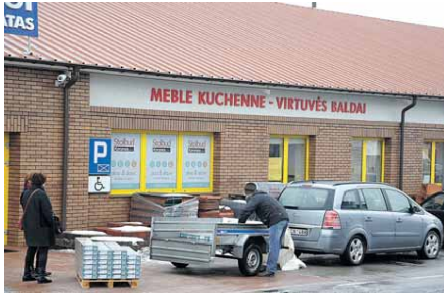
Suvalkai, lietuviai perka laminatą