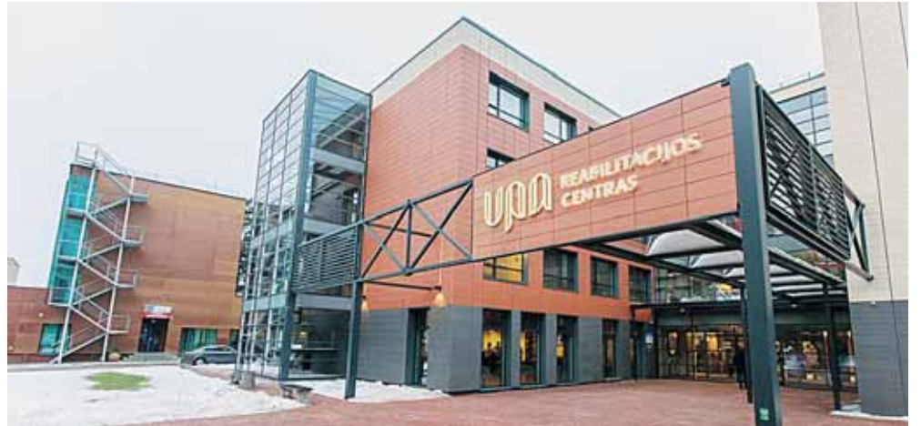
Reabilitacijos centras „Upa“, esantis Sveikatos g. 36, prie Druskininkų ligoninės