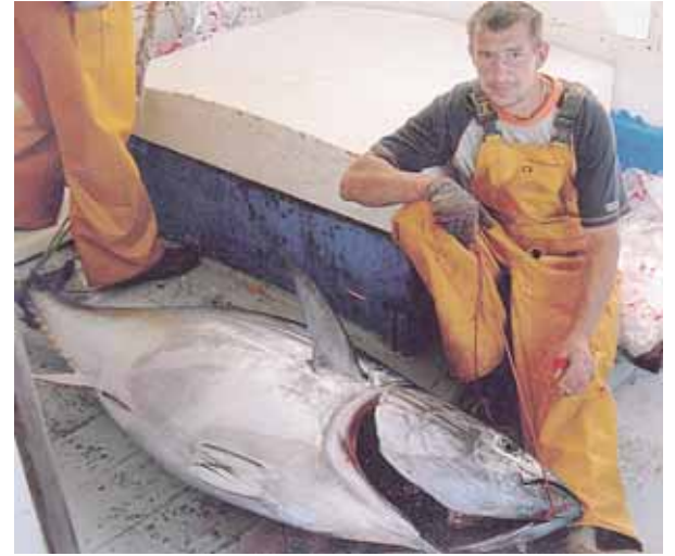
Didžiausias igulos sugautas tunas svėrė 264 kg