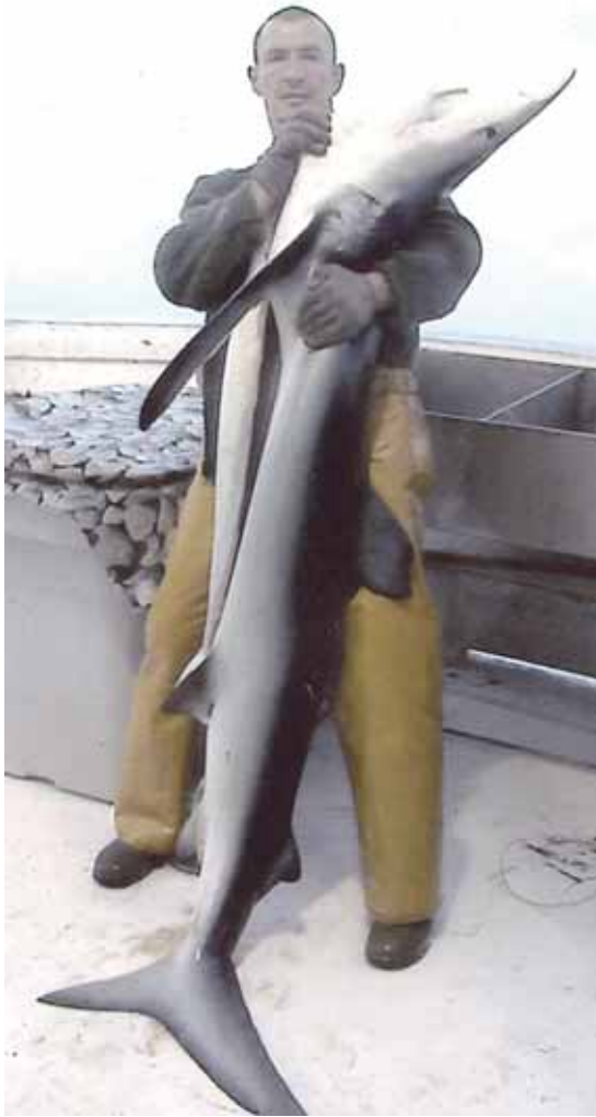
Sugauti rykliai paprastai sveria iki 150 kg