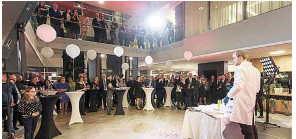
„Upos“ gimtadienio šventės svečiai stebi N2 pasirodymą