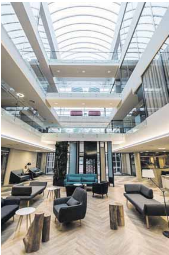
Pavadinimas „Upa“ centrui suteiktas pagal mitologinę baltų šaltinių, upių ir vandenių dievybę. Centro interjeras – įkvėptas baltų kultūros ir mitų, Lietuvos gamtos spalvų