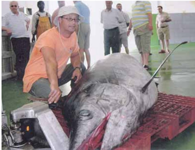
Žvejybinio laivo vienas didžiausių laimikių - 318 kg sverianti kardažuvė