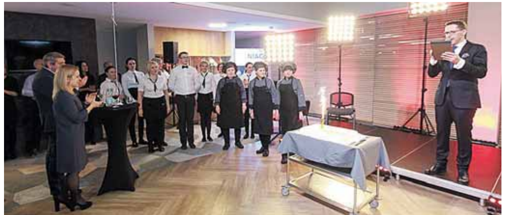
„Upa“ virtuvės ir restorano komanda