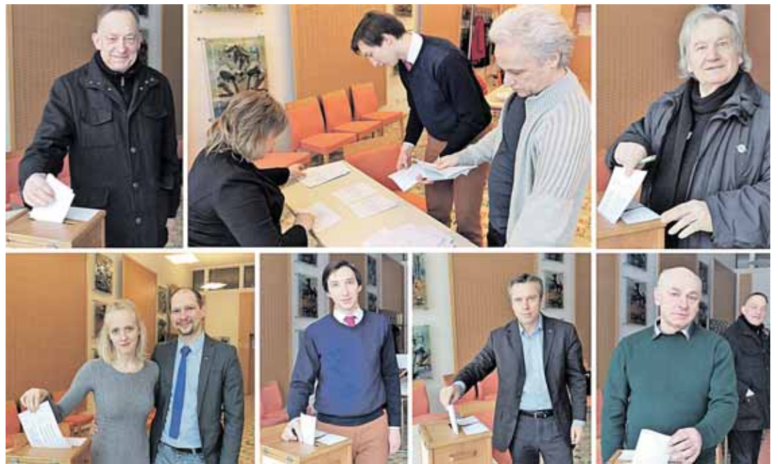
TS-LKD partijos nariai druskininkiečiai renka savo partijos pirmininką