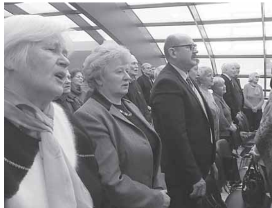
Renginio pradžioje visi sugiedojo Lietuvos himną