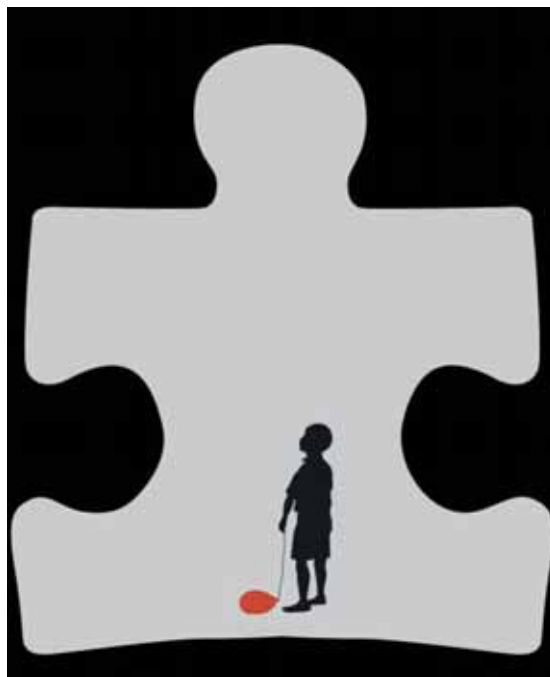
Autizmu sergantys vaikai dažnai vadinami „lietaus vaikais“

„Klausiu – patarkite, kaip mums elgtis, kai vaikas užsimoja kėde? Dabar mus taršo, bet į šį klausimą niekas neatsako. Padaviau joms vaiko dokumentus su diagnozėmis, kad susipažintų, kokį vaiką auginame, bet joms tai buvo neįdomu. Sakau: tokiems vaikams trūksta dienos centrų. Kai mes ištisai kartu viename kambaryje, ir mums, tėvams, stogas važiuoja. Čia esam mūsų asmeninės problemos. Tai kam tokia tarnyba reikalinga, kuriai nie-