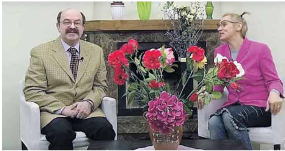
„Dviračio šou“ laidos stop kadras

išnaudokim galimybę šiandien pagerbti, pasveikinti savo mylimąsias, - toliau savo sveikinimą tęsia Z.Streikus. - Mielos moterys, su nuostabia pavasario švente. Jūs būkite kaip pavasario saulės, skleiskite savo artimiesiems ir mylimiesiems šilumą ir šviesą, kaip pavasario gėlės būkite žavios ir nepakartojamos, kaip pavasario lietus jūs būkite žaismingos ir nenusėjamos, kaip pavasario upeliai mielos ir mylimos, kaip pavasario paukščiai linksmos ir ištikimos, kaip pavasario naktys paslaptingos. Ir noriu jus pasveikinti su šia švente ir palinkėti, kad visada būkite orios, mylimos ir mylinčios“.