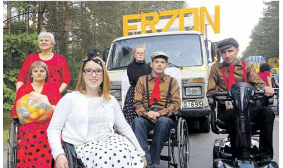
Kurorto šventės eisenoje