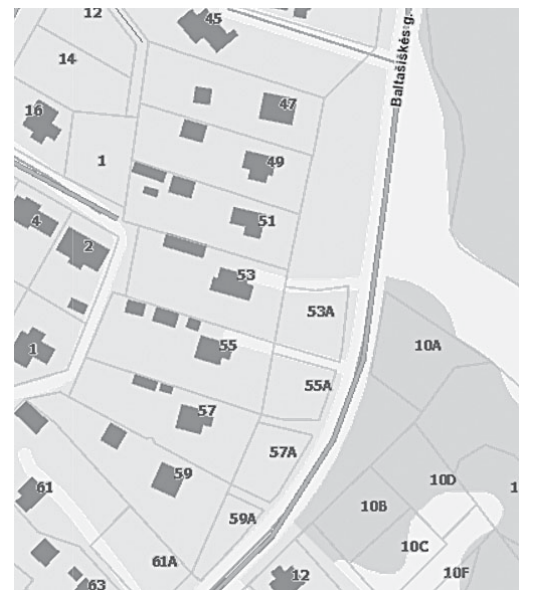
Teritorijos schema iš REGIA