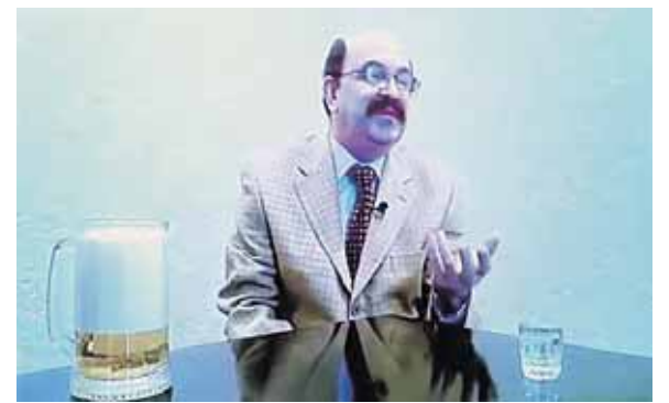
„Sveikina moteris su vyrų diena“