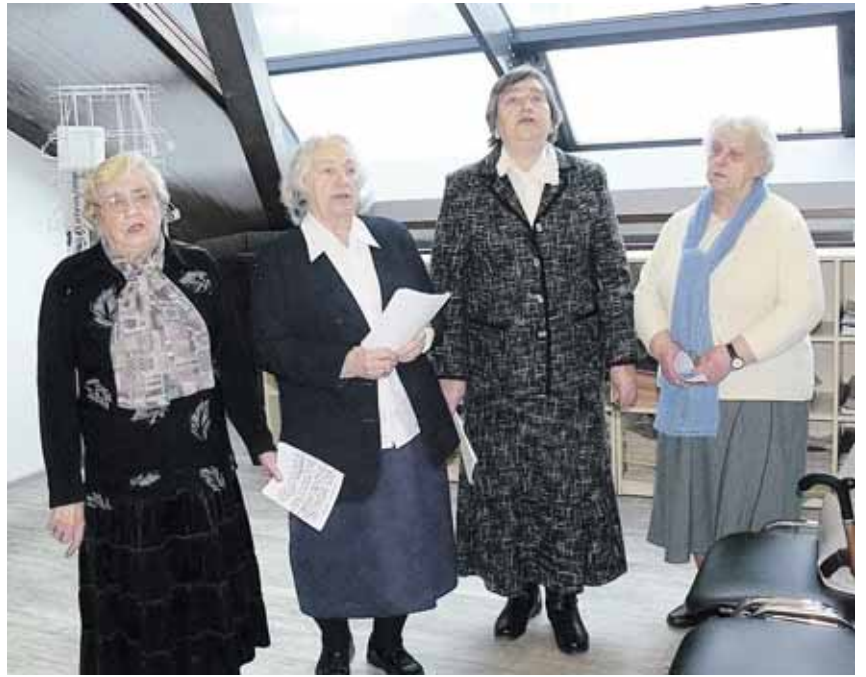
Buvusio "Ratnyčelės" ansamblio dainos