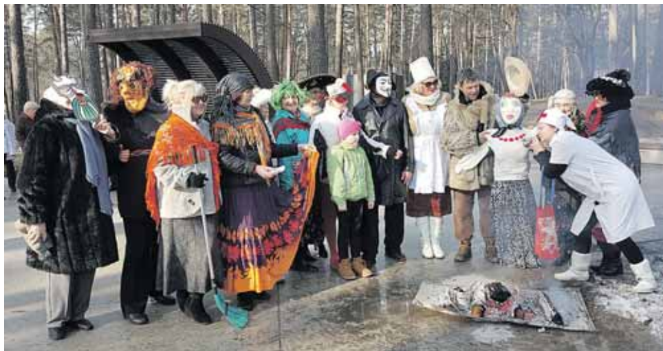
Šiemetinės Užgavėnės Karolio Dineikos sveikatingumo parke