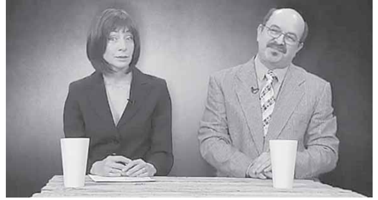
Laidos „Dviračio šou“ stop kadras

mų Lietuvoje yra kalčiausia žiniasklaida?“ - pagaliau atsipeikėję laidos vedėja.