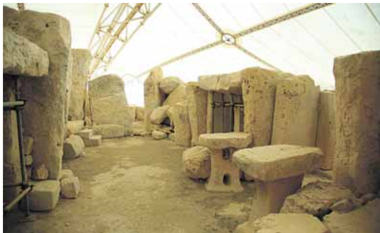
Senasis Maltos paveldas