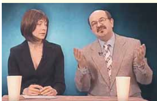
Laidos „Dviračio šou“ stop kadras

Pareguliuoti žiniasklaidą sumanęs Z.Streikus vėl tapo „Dviračio šou“ personažu