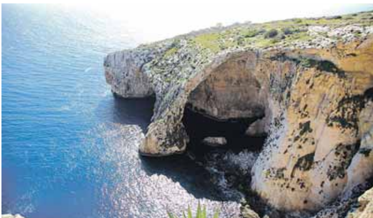
Jūros urvas Blue Grotto Maltoje