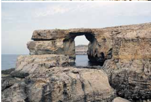
Žydrojo lango arka prieš audrą ir po jos