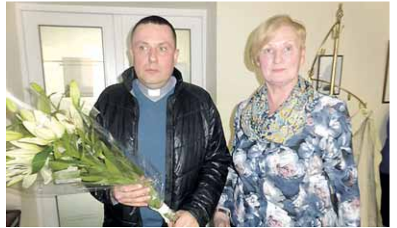
Po susitikimo TAU universitete

- Kaip jau sakiau, pamokslų per daug nesureikšminu. Yra daug svar-