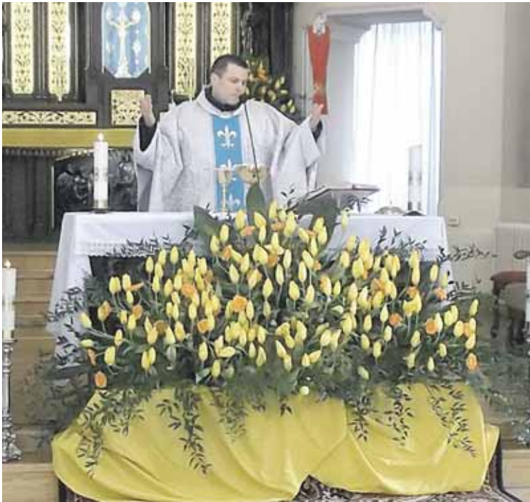
Vakarinės šv. Mišios gegužę Druskininkų bažnyčioje