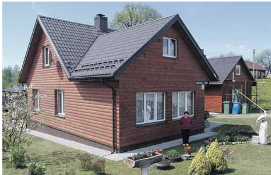
Graži sodyba Stračiūnų pradžioje, kur apsistoję daugiavaikė motina