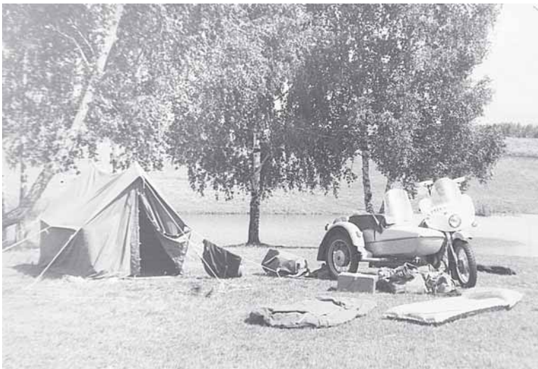
Iprasta Algirdo poilsio vieta įveikiant motociklu 22 tūkst. kilometrų