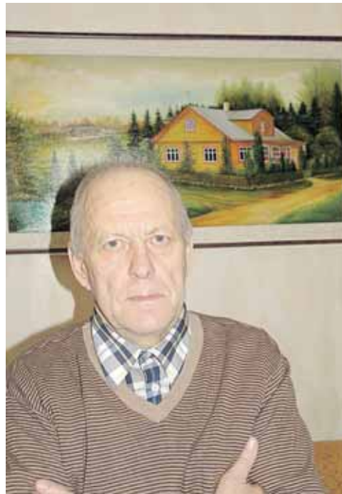
Prie paveikslų, kuriame nutapyta gimtoji sodya Suvalkijoje