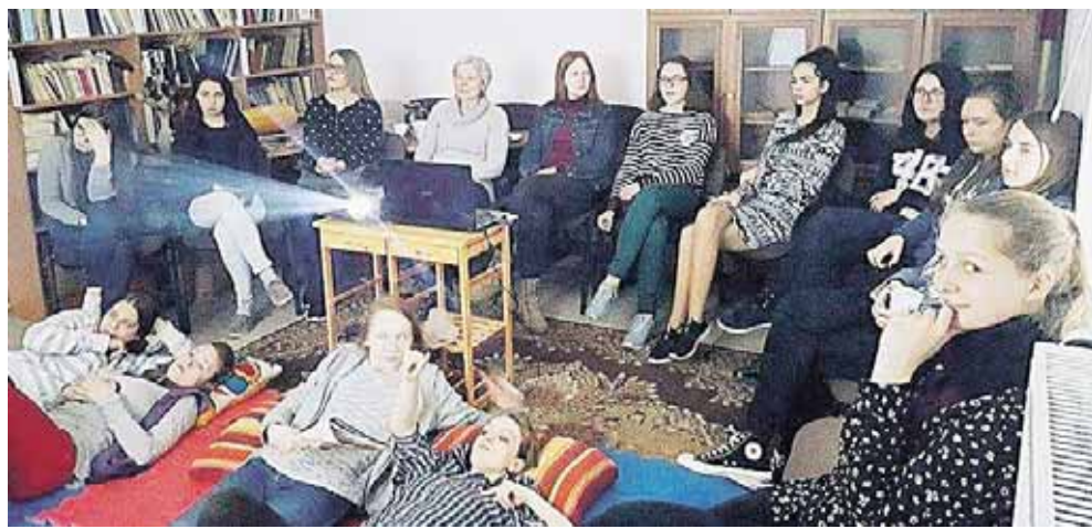
Filmo seansas „Gero kino vakarai“