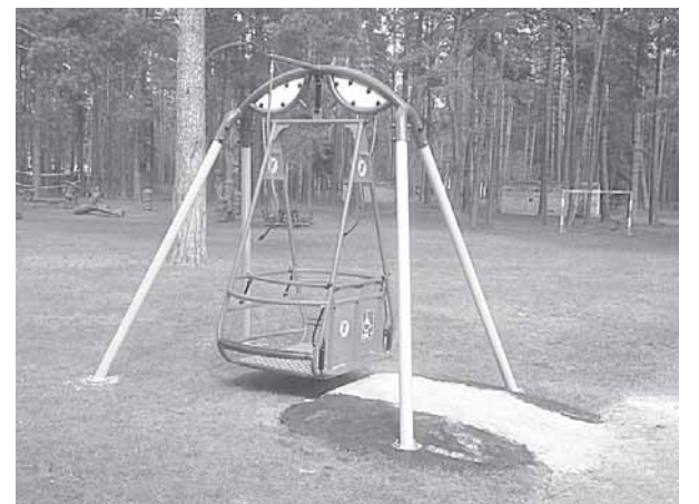
Padovanotos sūpuoklės „Saulutės“ teritorijoje

Jie sanatorijos lėšomis įrenginėjo sūpynes ir įdėjo daug darbo, nes ir pačios tokios sūpynės - labai nestandartinis įrenginys. Net pažiūrėti, kaip kitur įrengta ar pasikonsultuoti, nelabai kur buvo galima. Ir kas labai svarbu, kad jie geranoriškai priėmė iniciatyvą ir ėmėsi ją įgyvendinti. Noriu akcentuoti šio neįprasto projekto bendrą darbą: aš sūpynes nupirkau, o „Saulutė“ savo lėšomis sklandžiai sumontavo. Galiu iš patirties pasakyti, kad net-