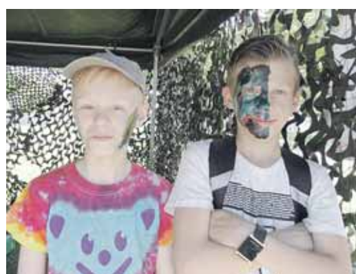
Vaikus labiausiai traukė galimybė išsimarginti veidus kariniais slepiamųjų spalvų dažais