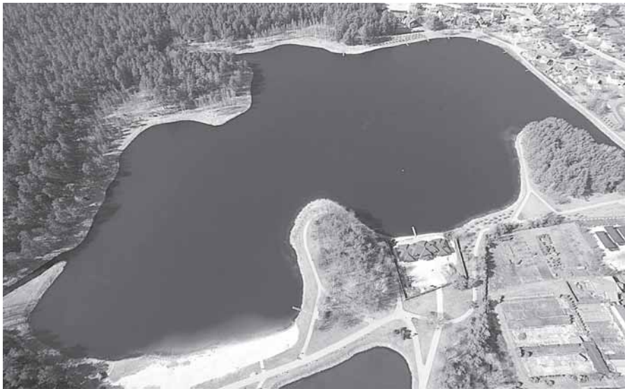
Vijūnėlis iš viršaus

A ukščiausiojo Teismo Civilinių bylų skyriaus trijų teisėjų kolegija trečiadienį nagrinėjo Druskininkų savivaldybės skundą dėl sprendimo griauti gyvenamąjį namą Druskininkų centre, ant Vijūnėlės tvenkinio kranto.