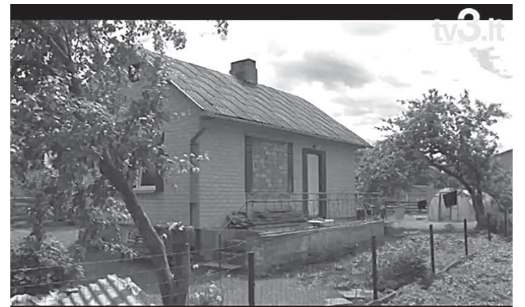
TV3 laidos stop kadrai

Lietuviai Jonines šventė su trenksmais. Per dvi savaitgalio dienas visoje šalyje iš girtų tėvų buvo paimta maždaug 10 vaikų.