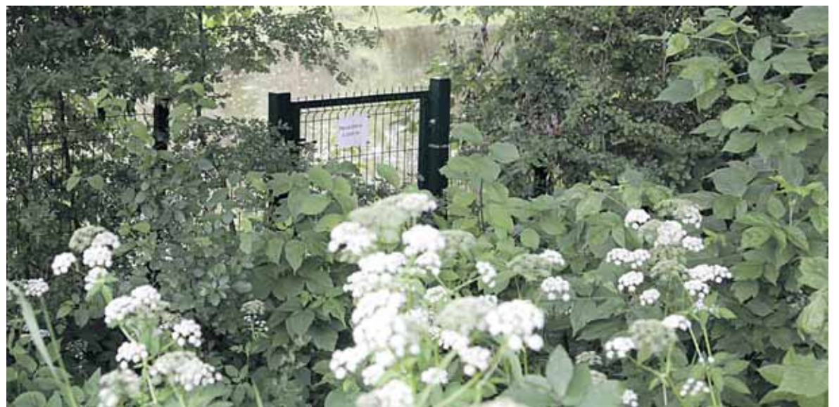
Tvenkinys valstybinėje žemėje greta R.Malinausko sklypo: 2006 ir 2012 metai

Tačiau teisėsauga buvo kitokios nuomonės ir paneigė Druskininkų savivaldybės žodžius. 2013 metais situaciją dėl galimos žemgrobstės teritorijoje nagrinėjo Specialiųjų tyrimų tarnyba (STT). Tarnyba atsisakė pati pradėti ikiteisminį tyrimą, nes nerado nusikaltimo sudėties, tačiau