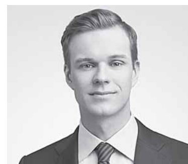
Gabrielius LANDSBERGIS Seimo narys, TS-LKD pirmininkas

Apie tokią smagią iniciatyvą sužinojau iš socialinių tinklų bei žiniasklaidos ir iškart pažadėjau Facebook draugams užsukti su pledu ir kepsnine, kaip ir pridera tikrajam piknikui. Todėl mane ten sutiks. Kalbant rimčiau, teismui panaikinus neteisėtą žemės nuomos sutartį ir jai tampant rekreacinės teritorijos dalimi, galimybė ja laisvai naudotis turi būti sudaryta nedelsiant. Manau, piknikauti atėję žmonės turės puikią galimybę tai padaryti – pasinaudoti savo teise. Juo labiau, šventinė progą tikrai yra: teismas dar kartą patvirtino injuria jus non oritur principą (iš neteisės teisė nekyla) ir grąžino nemažą parko ir pakrantės dalį visuomenei – druskininkiečiams ir svečiams.