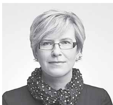
Ingrida ŠIMONYTĖ Seimo narė

Teko girdėti apie šį pikniką socialiniame tinkle, žmonės kalba. Matyt, tai piliečių iniciatyva, siekianti atkreipti dėmesį į garsiai nuskambėjusį skandalą bei noras paraginti žmones būti dar pilietiškais ir griežčiau vertinti galimus neteisėtus statybos ar kitus korupcinės veiklos atvejus. Nežinau, ar pavyks sudalyvauti šiame renginyje, bet visuomet palaikau piliečių iniciatyvas, man tai lyg įrodymas, kad demokratija Lietuvoje veikia.