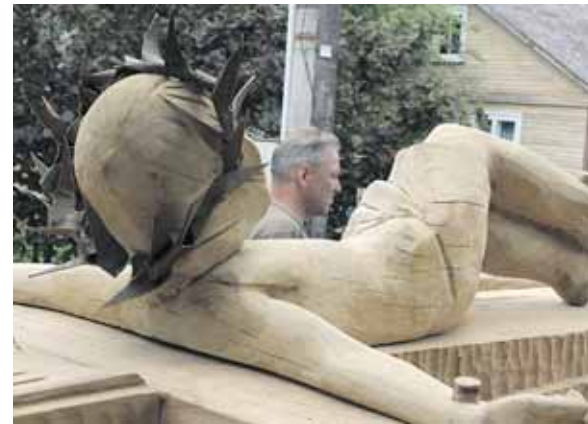
Išgabenant kryžių iš Ratnyčės