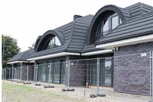
Vijūnėlės dvaro šeimininkas skubiai "pasiruošė" piknikui 2 psl.

Policijai teks ginti Vijūnėlės dvarą: negalima bus nieko griauti ir nuogiems maudytis