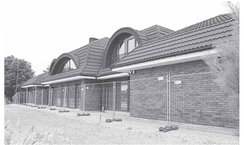
Vijūnelės dvaro šeimininkas skubiai „pasiruošė“ piknikui

Druskininkų kurortinėje zonoje, prie Vijūnelės tvenkinio sudegusio valčių nuomos punkto vietoje, 2013 metais buvo pradėtas statyti beveik 600 kvadratinį metrų gyvenamasis namas, druskininkiečių netrukus buvo pramintas Vijūnelės dvaru. Leidimus jo statybai išdavė Ričardo Malinausko vado-