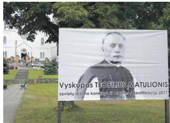
Prie Alantos bažnyčios liepos 25 d.