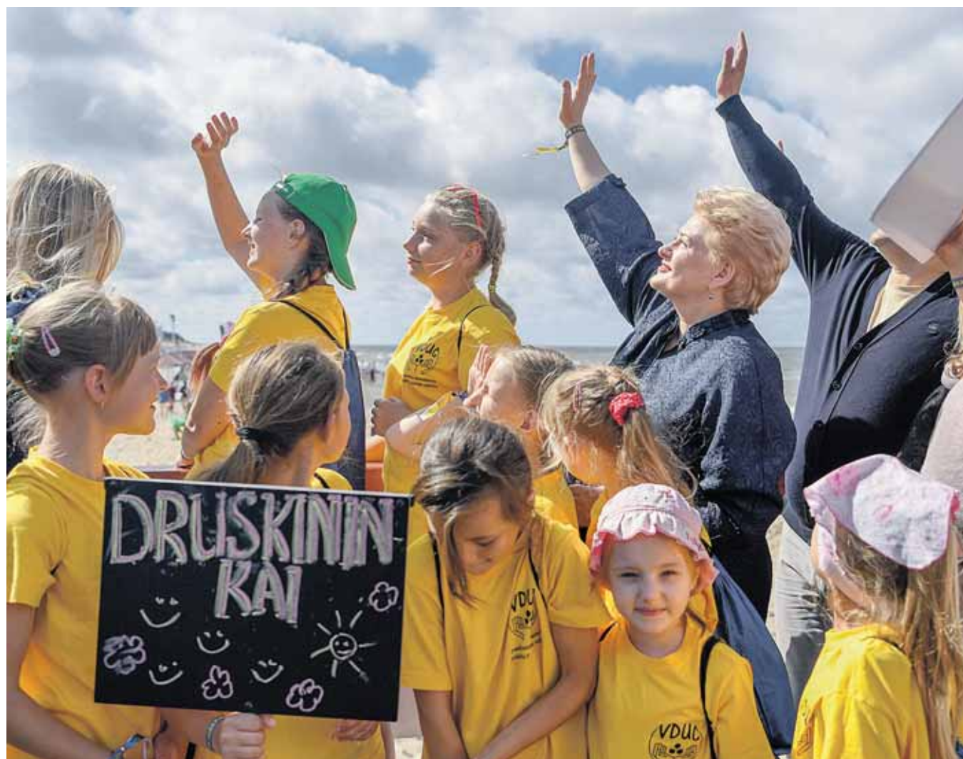
Dešimt vaikų iš Druskininkų praėjusį savaitgalį ne tik pirmąkart pamatė jūrą, bet ir turėjo unikalią progą pabendrauti su Prezidente 6 psl.

Palanga svetingai priėmė jūros nemačiusius Druskininkų vaikus, dėmesį jiems skyrė ir Prezidentė