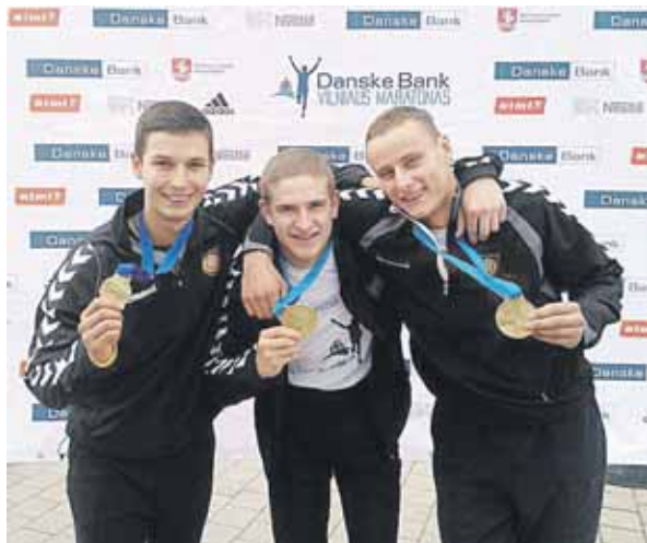
Fizinę ištvermę kariūnai ugdo ir maratonuose

Visos šios kelionės paliko labai gerus išpūdžius ir prisiminimus. Neapsakomai įdomu pabendrauti su užsienio valstybių kariais neformalioje aplinkoje.