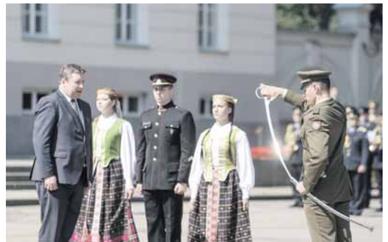
Iškilmingos ceremonijos akimirkos

rinę ekipuotę. Taip pat kiekvienam kariūnui yra mokama stipendija.