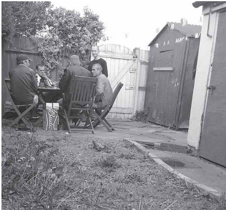
Alų geriantys rumunų statybininkai

„Negadink man kelionės, nes įrėšiu šitą mikroautobusą į medį ir nebekliedėsi apie jokias Italijas“,