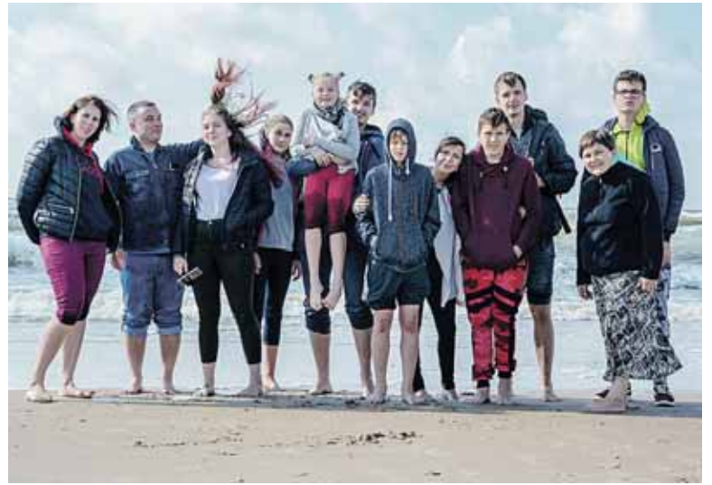
Šios vasaros viešnage prie jūros

Džiugučiai turi savo dorines taisykles, kurios formuluojamos vaikams suprantama ir paprasta kalba, išvengiant biurokratiškos rėmų. Bandoma ne kovoti su informacinėmis technologijomis, bet suvokti jų vietą realiame gyvenime. Yra toks terminas, kaip telefoninė. Telefonai ilsisi - miega, kai vyksta kita svarbi veikla - pamokų ruošimas, pašnekesys su tėvais ar vadovais ir t.t. Džiugučiai turi savo mėgstamų veiklų, kurių laukia ir noriai dalyvauja. Jos jau tradicinės: vasaros stovyklos, dviračių žygiai, ekskursijos, dalyvavimas religinėse šventėse, susitikimai su įvairių profesijų žmonėmis. Antai šiemet vykusiuose šv. Baltramiejaus atliuose šie vaikai tiesiog atliko svarbiausią rolę agapės metu. Pliaupiant lietui ir užaujant rudeniškam vėjui, vaikai ir paaugliai mikliau nardė tarp suaugusiųjų, kai reikėjo pamaitinti gausiai susirinkusių minią. Grožėjais iš šalies, matydamas, kaip jiems tiko ir pritiko ši veikla. Į juos buvo žiūrima su mei-