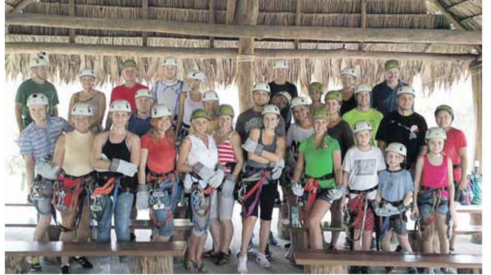
Vestuvių išvakarėse visiems svečiams buvo suorganizuota išvyka lynais po Kosta Rikos džiungles, kurioje visi jie iki vieno dalyvavo