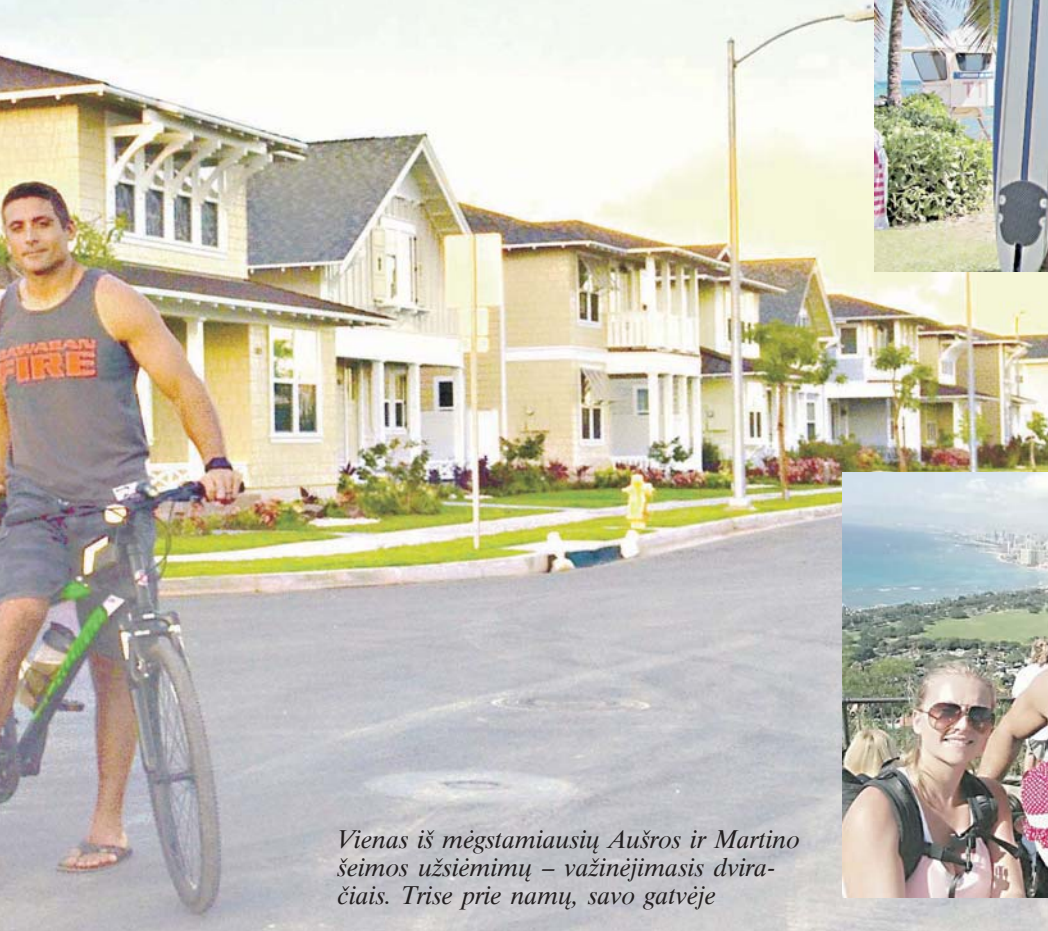
Vienas iš mėgstamiausių Aušros ir Martino šeimos užsiėmimų – važinėjimas dviračiais. Trise prie namų, savo gatvėje

šskridusi prieš dešimtmetį, šiandien su šeima gyvena ir ilgisi ko, tai tik vieno – atostogų Druskininkuose.