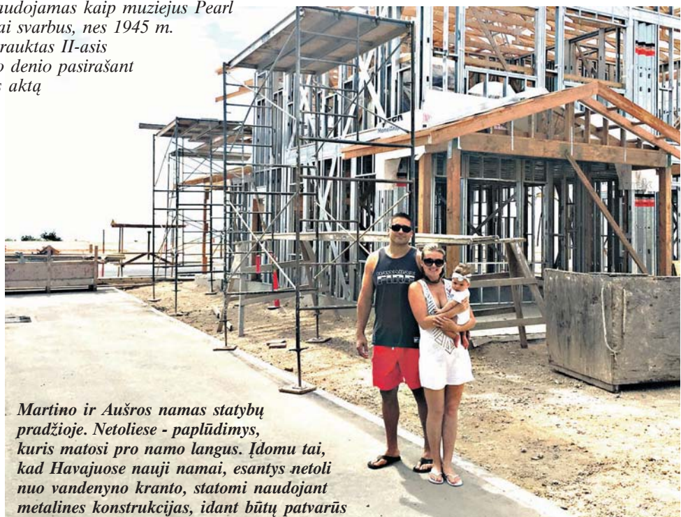
Martino ir Aušros namas statybų pradžioje. Netoliese - paplūdimys, kuris matosi pro namo langus. Įdomu tai, kad Havajuose nauji namai, esantys netoli nuo vandenyno kranto, statomi naudojant metalines konstrukcijas, idant būtų patvarūs stichijų metu. Taip pat šie namai neturi žemutinio rūsio aukšto