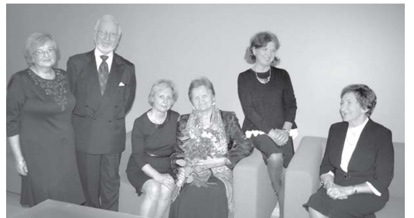
Tarptautinio menų festivalio „Druskininkų vasara su M.K.Čiurlioniu“ organizatoriai, LMRF vadovai ir atstovai, žiūrovų dėmesio tikisi ir kitąmet