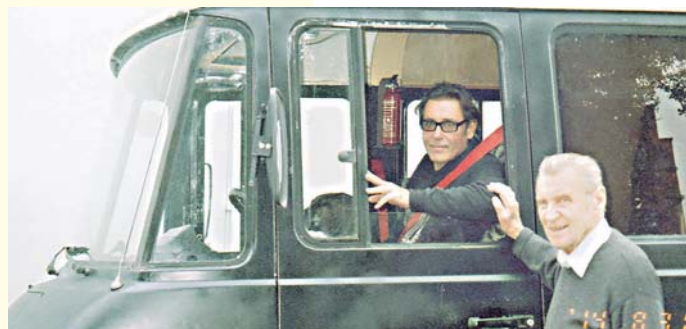
Restorane „Vitaminas B12“ atidaryta tėvo ir sūnaus Šaitūnų kūrybos paroda

„Padėti Ukrainai – mūsų moralinė pareiga“, -