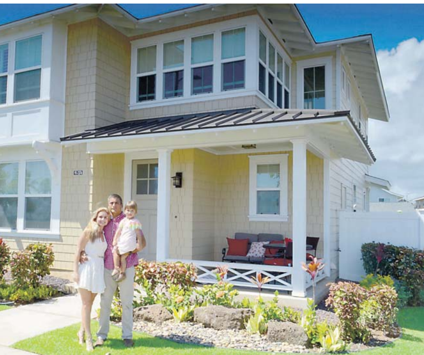
o namų, kurie išgytame plyname lauke prie jūros buvo itin sparčiai pastatyti,