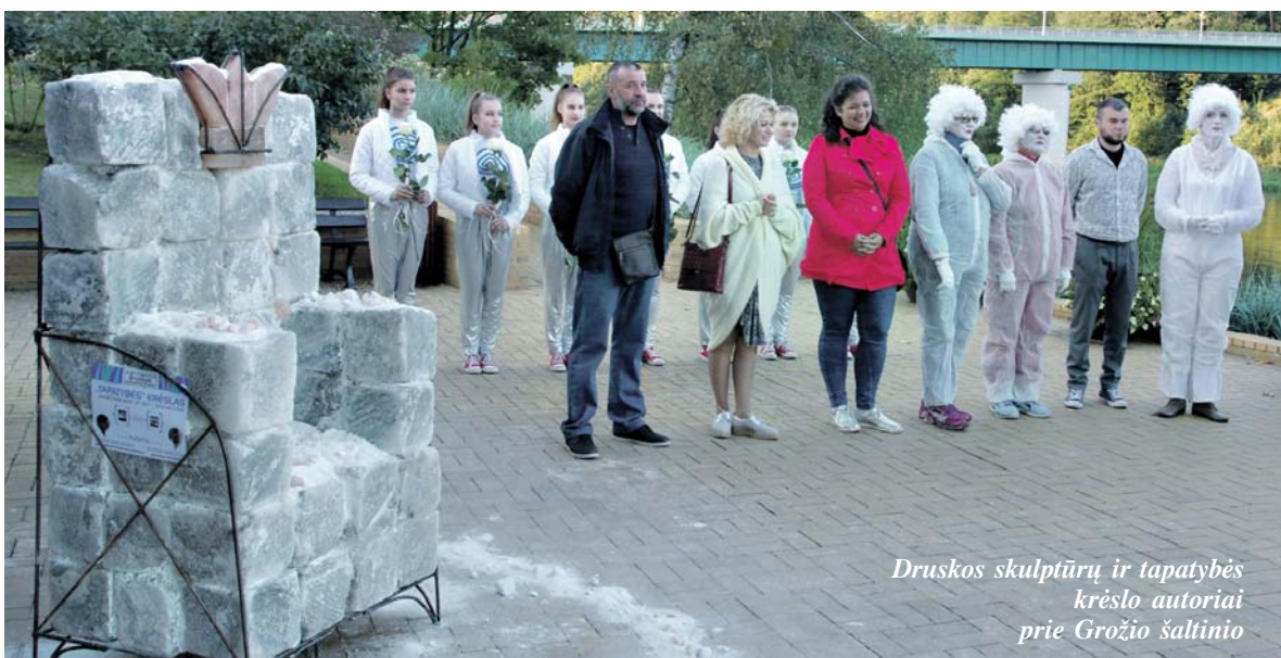
Druskos skulptūrų ir tapatybės krėslų autoriai prie Grožio šaltinio