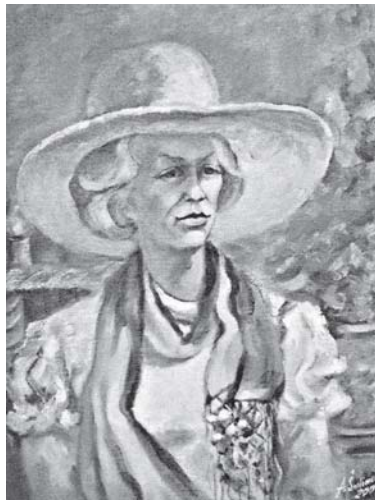
Moteris mėlynu šaliku