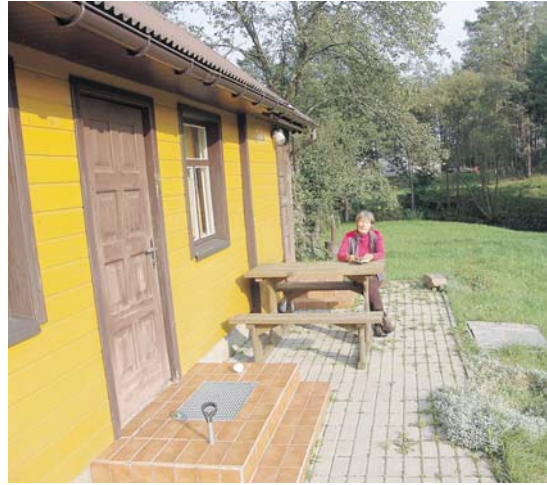
Pirtelė Jaskonių upelio pakrantėje