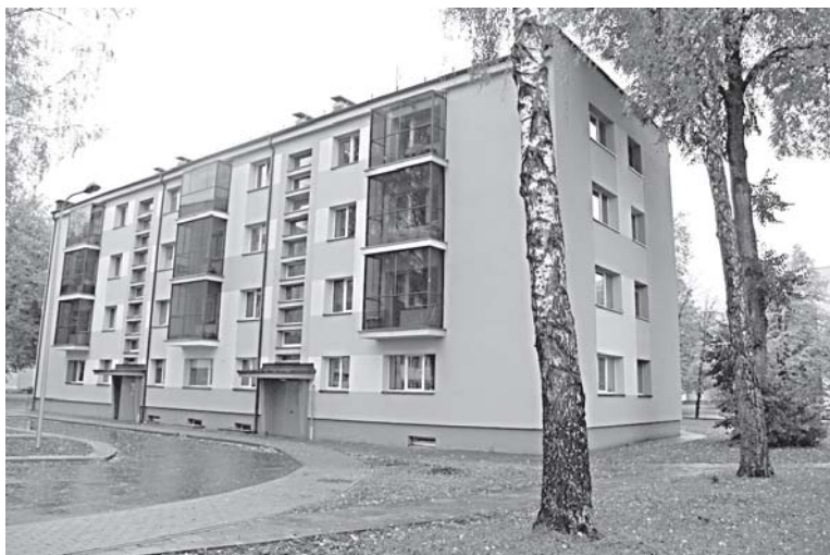
Neseniai renovuotas daugiabutis M.K.Čiurlionio g. 74

„Viskas taip ir liko pažadais. Sakė, darys kovo mėnesį. Praėjo ir kovas, ir balandis, ir gegužė. Liepą skambinau – visai nekėlė ragelio. Ar mano telefono numerį įsivedė, ar kas, nežinau. Dukart