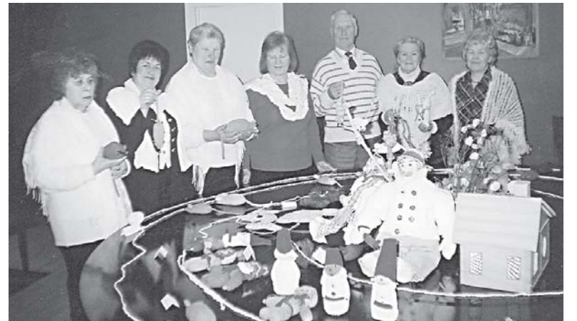
„Bočių“ bendrijos etnogrufės „Kraitė“ nariai Advento pradžios savo rankdarbių parodoje