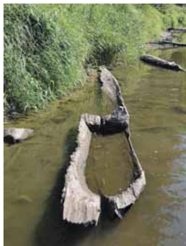
Nuskendęs žvejų luotas prie Pukštančio rėvos, žemiau Maksimonių