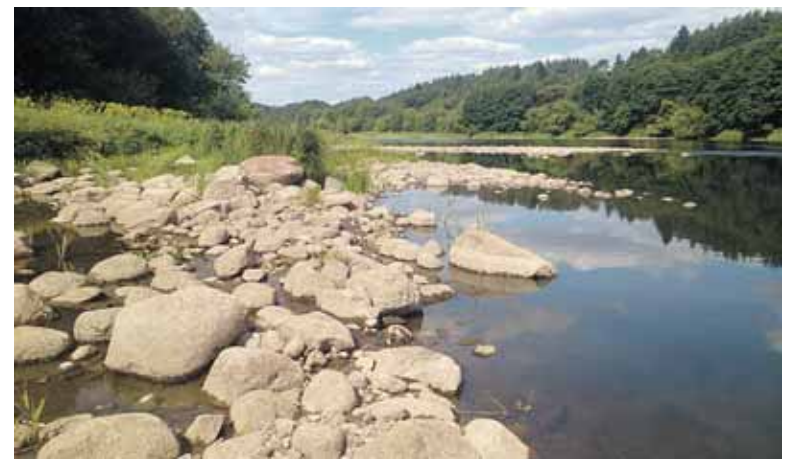
Nusekės Nemunas Druskininkuose, žemiau Ratnyčios žiočių, 2015 m.