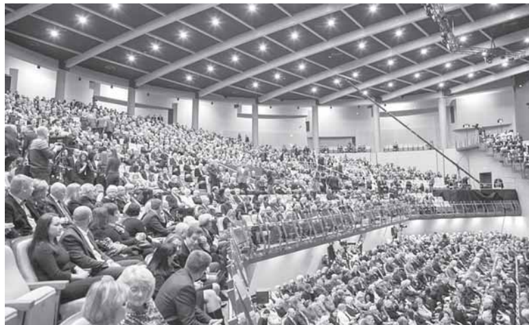
„Mes pasistatėme kultūros salę už 9,45 mln. eur“, - „Druskoniui“ sakė Palangos meras Šarūnas Vaitkus

„Mūsų ponas pramušinėja objektą už 15 mln. eur, kai Palanga