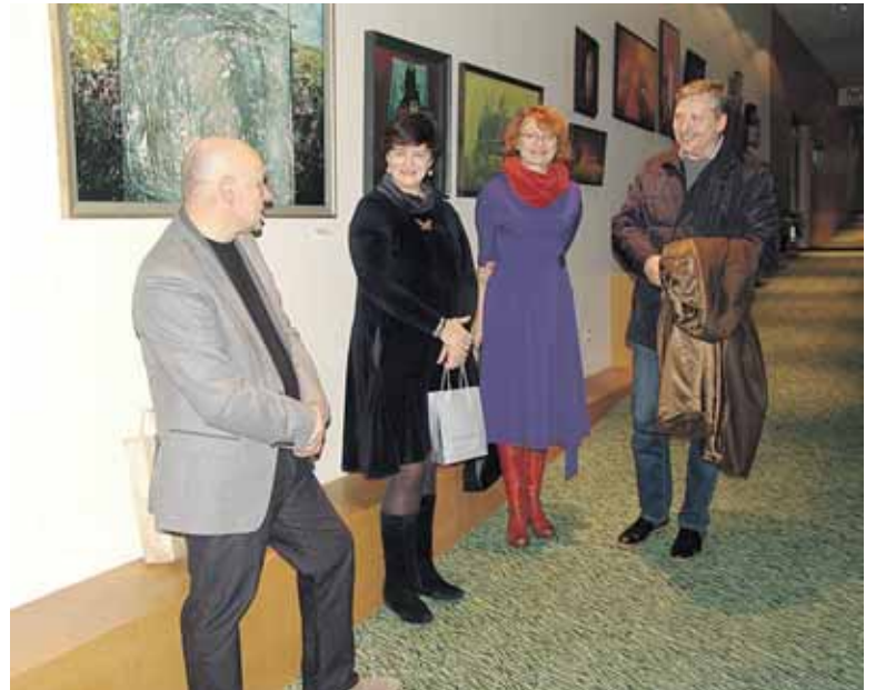
Prisiminė buvę mokiniai