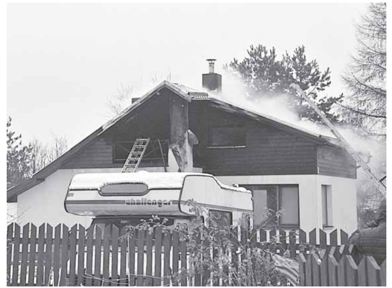
Gyvenamojo namo Nervuose, Dainavos 2-ojoje g. 16, gaisras gruodžio 1-ąją

Iš gelbėjimo darbų, kuriuos Druskininkų ugniagesiams gelbė-