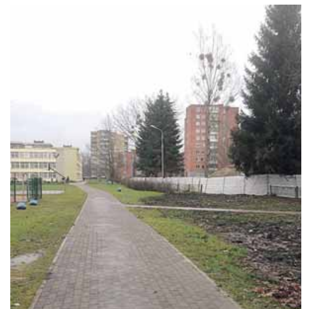
Pakelė link „Saulės“ pagrindinės mokyklos - be eglėlių