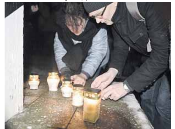
Druskininkų asociacijos dailininkų grupės 3X grupės nariai bei jų bičiuliai uždegė žvakutes ir ant Mažosios galerijos laiptų

kankamai talpus Mažosios galerijos ankstesnė gyvybė ir dabartinėmis nykoma nuotaikomis jos prieigose. Tik rudeniai lapai sukūriais sukasi ir laukiniai kačiukai bėgioja – liudija Mažosios galerijos dabartį R. Jarašausko sukurtas filmukas. Jis SPA Vilnius konferencijų salėje buvo parodytas ir kitą dieną, gruodžio 2 d., po dailininkų grupės 3X vado