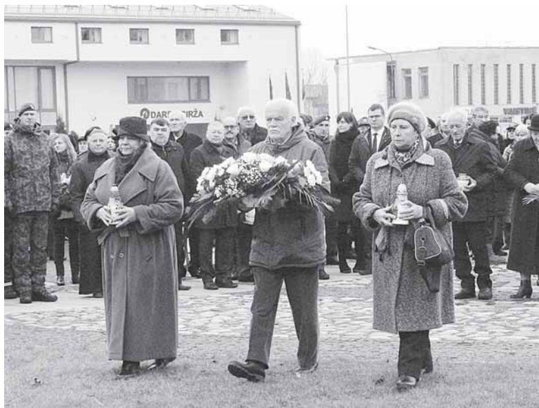
Druskininkiečiai neša gėles prie Adolfo Ramanausko-Vanago paminklo Lazdijuose