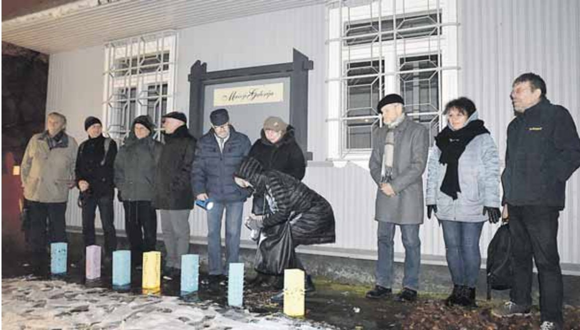
Tylos minutė su žvakutėmis, skirta Mažosios galerijos 1-erių metų atminimui

Čiurlionio namų pašonėje, būriavosi Druskininkų asociacijos dailininkų grupės 3X grupės nariai bei jų bičiuliai uždegti galerijos vienerių metų atminčiai skirtas žvakutes, na, ir prisiminti 23-ejus jos gyvavimo metus iki praėjusių metų gruodžio 1 d., kai vietinės valdžios pareigūnai paliepė menininkams skubiai iš šių patalpų išsikraustyti.