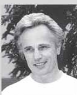
ANTANAS BALKĖ Akmeninis augalas, 2006 Stone plant