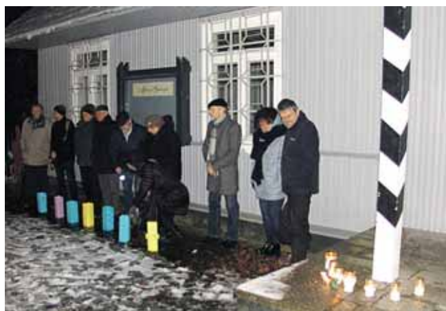
Tylos minutė su žvakutėmis, skirta Mažosios galerijos I-erių metų atminimui