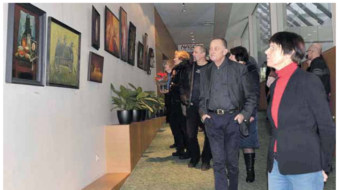
Andriaus Mosiejaus tapybos ir ansambliužų paroda „Sugrįžimai“ eksponuojama SPA Vilnius