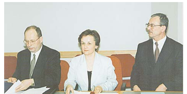
Europos reikalų ministrė Briuselyje, 1997 metai