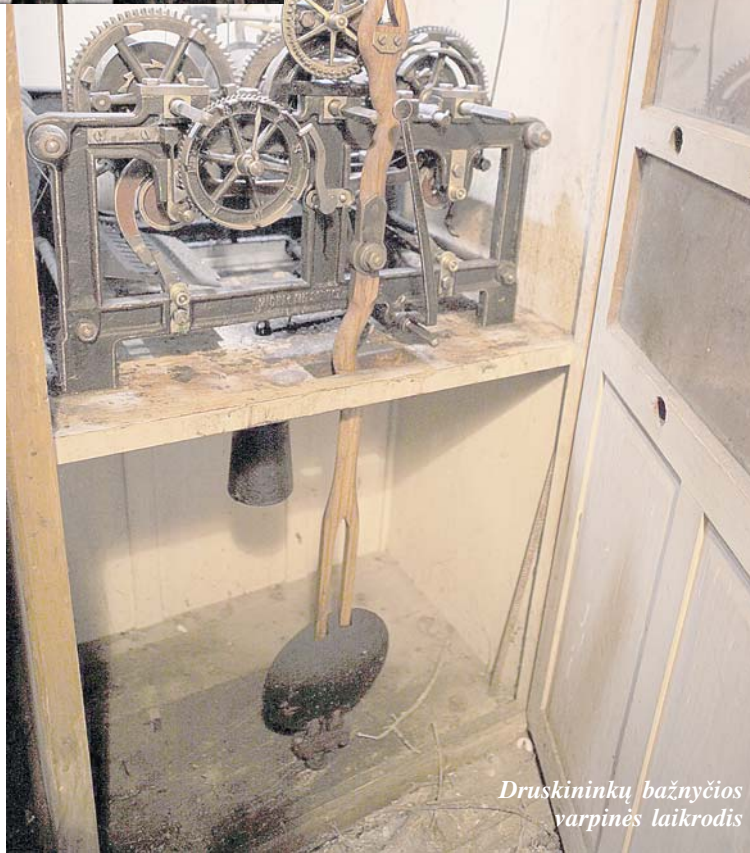
Druskininkų bažnyčios varpinės laikrodis

Trečiasis Druskininkų varpas, išvežtas į Rusiją Pirmojo pasaulinio karo metais, buvo pats mažiausias ir pats jauniausias, nulietas