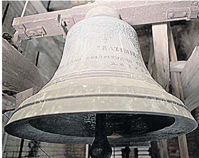
Druskininkų Švč. Mergelės Marijos Škaplierinės bažnyčios varpai

„1915 m. vasara Lietuvos varpams buvo lemtinga – carinės valdžios nurodymu jie buvo masiškai vežami į Rusijos imperijos gilumą, kad vokiečiai negalėtų varpų panaudoti kaip žaliavos karinei pramonei. Taip nutiko ir Druskininkų bažnyčiose varpams. Archyvuose neseniai rasti dokumentai suteikia daug žinių apie jų likimus. Aiškėja, kad varpai iš pradžių buvo nuvežti į Maskvą, o vėliau dar toliau į rytus – į Šują, miestą Ivanovo srityje, kur jų pėdsakai pradings-ta“, – pasakoja dailės istorikas dr.