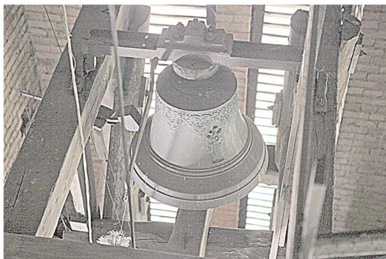
Vertingiausių Lietuvos varpų projekte - Druskininkų bažnyčios varpai