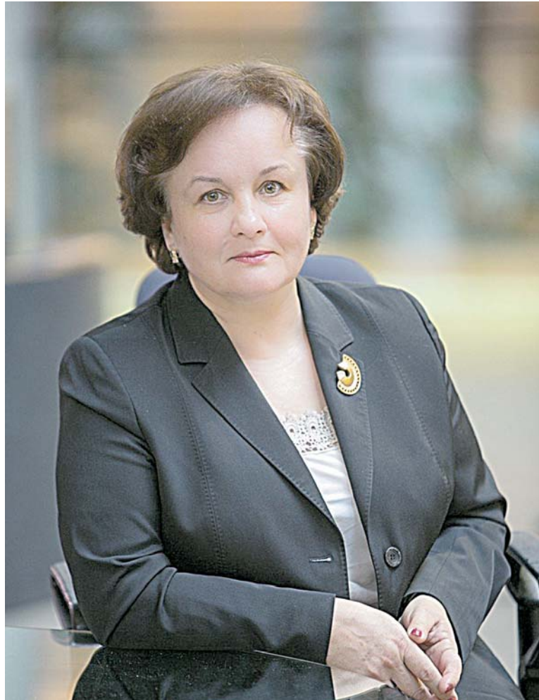
Laima Liucija Andriekienė, Europos Parlamento narė nuo 2016 m. bei 2004–2014 metais