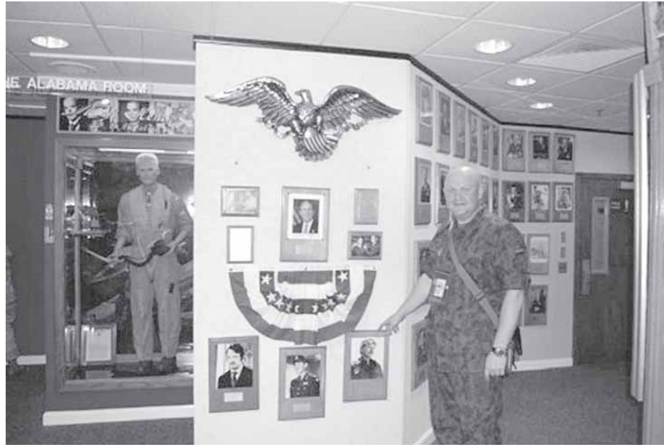
Straipsnio autorius šalia Č. Bronsono nuotraukos, centre – JAV prezidento Dž. Bušo nuotrauka