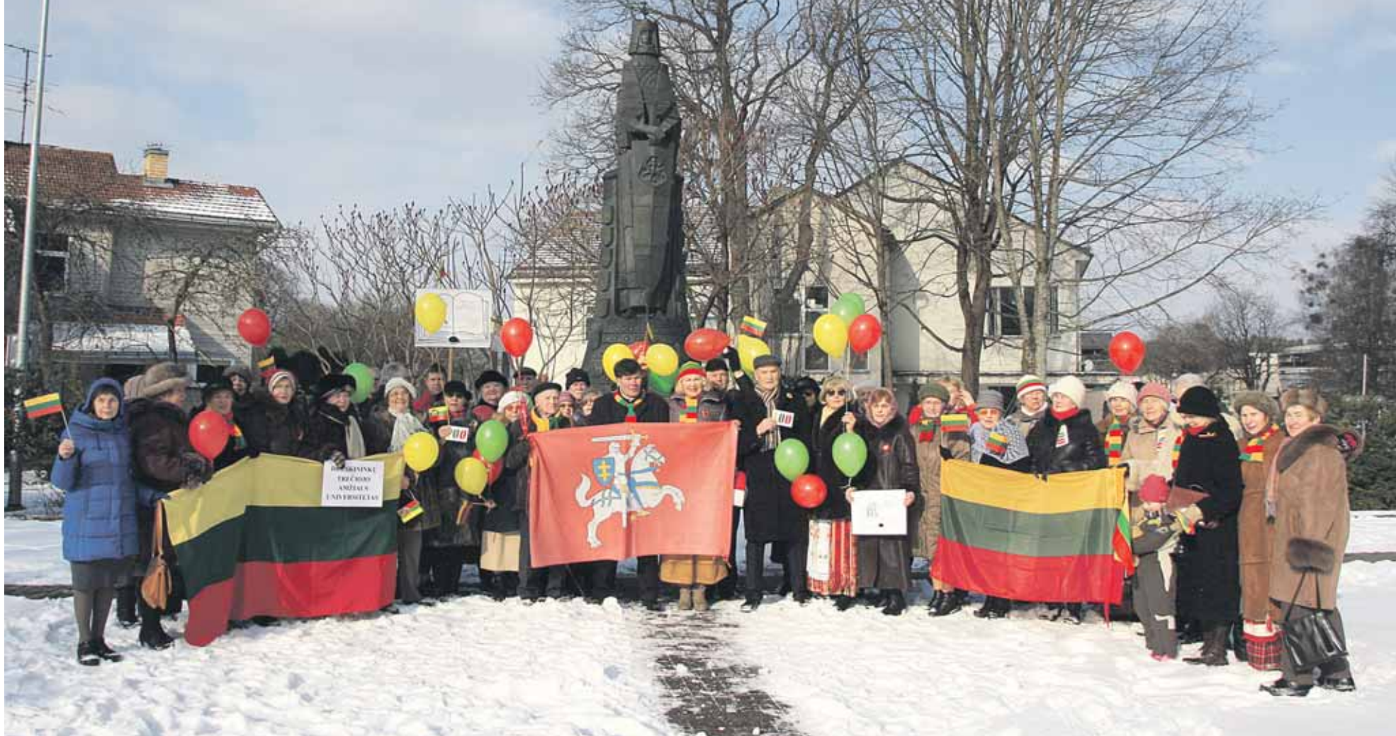
Druskininkų Trečiojo amžiaus universiteto lankytojai, šįmetinę Vasario 16-ąją švęsdami Valstybės 100-metį, Lietuvos himną sugiedojo prie Mindaugo paminklo