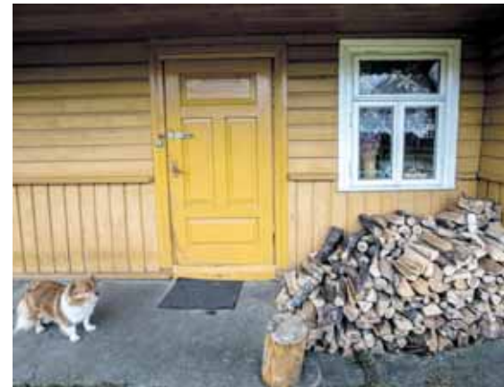
Senovės kaimas

O žalčių neseka mušc. Ba gi ji šventas Džievo padaras. Jaigu žalčį užmuši, tadu gyvenimi labai nesi-seks. Bus kokis nuostolis su gyvuliais. Tų prietarų mes lig šioliai laikomės. Ir gyvatių neseka mušc. Ji nepiktybiška. Nu susrango jinai prieg vandens bačkos, ba jai karšta. Tai ji ataina ir insitaiso, ba jai vēsu. Tai paēmēm ir išvarēm miškan. Gyvatė nuo žalčio skirias. Žalcy prieg žmogaus saugoja, šypia, duoda garsų. O gyvatės iškar susvynioja ir iškišus galvytį pilniavoja, kad tu aitai prieg jos ir inai tavi inkūs.