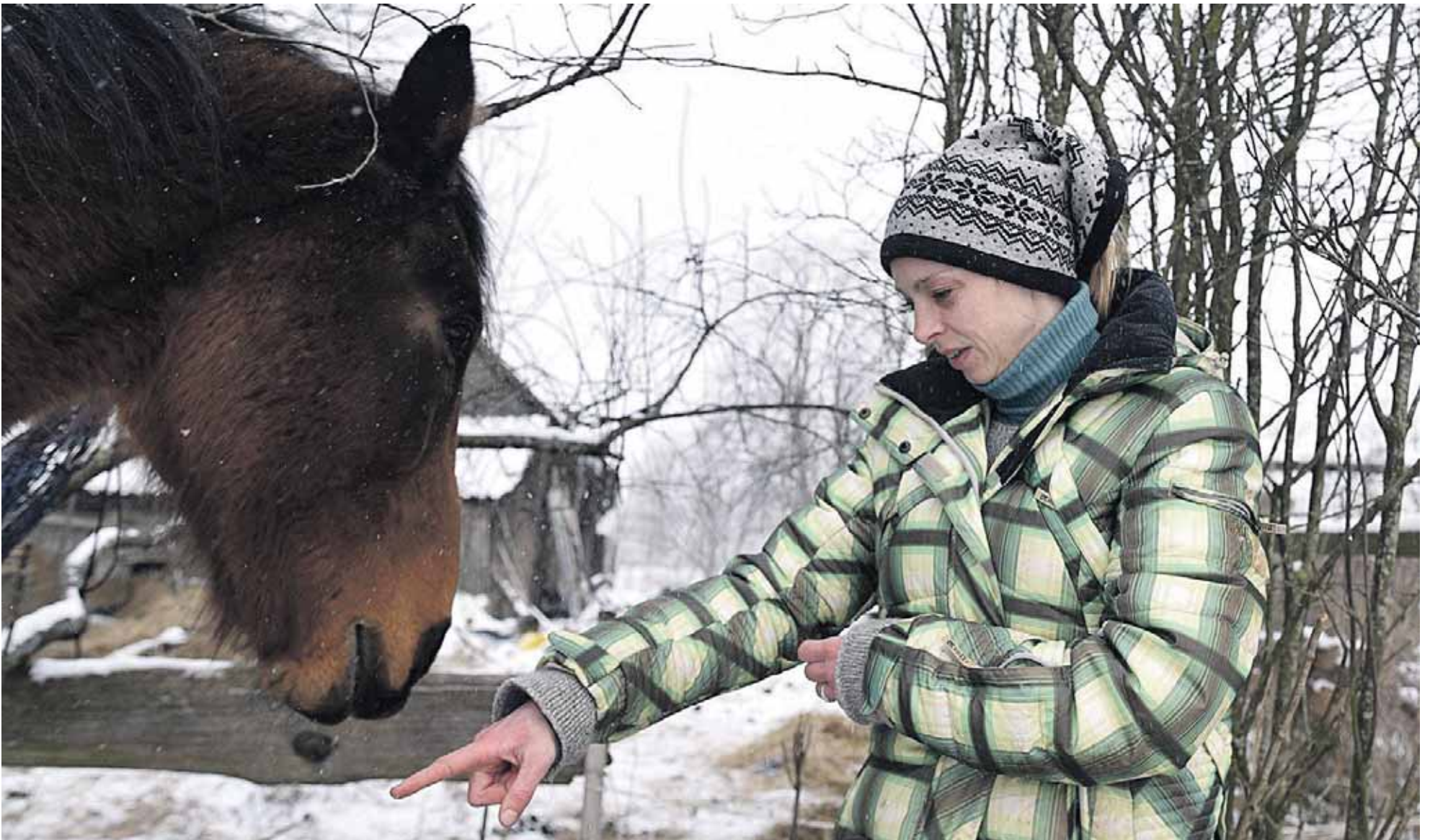
Olgos Choroškovos arklių prieglauda