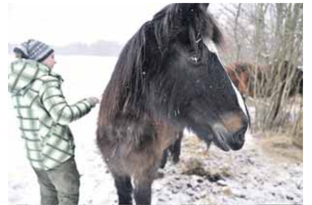
Romo Sadausko-Kvietkevičiaus nuotr.