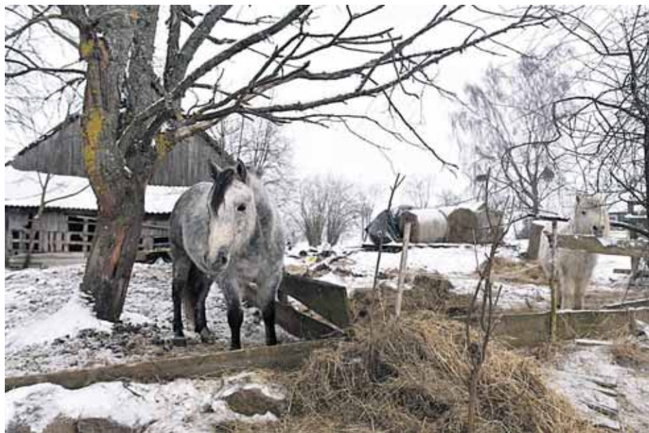
Olgos Choroškovos arklių prieglauda