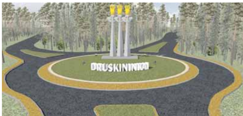
Naujajį ženklą ketinama įrengti iki šių metų vidurio

Neįtikėtini valdžios mostai: naujasis Druskininkų ženklas mokesčių mokėtojams kainuos beveik 300 tūkst. eurų