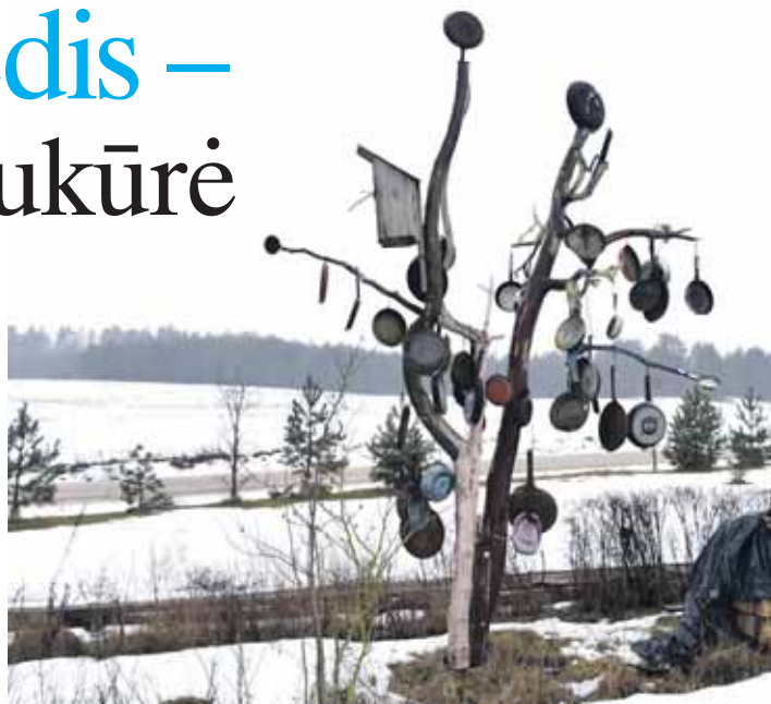
Myžonių keptuvių medis

Romas SADAUSKAS-KVIETKEVIČIUS, www.delfi.lt