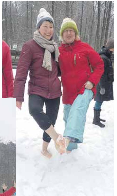
Grūdinimasis basomis ant sniego

pabendrauti, kartu pasimankštinti, pasigrožėti aukščiausią Druskininkų vieta – K.Dineikos parku – kalneliu, suformuotu iš kadaise buvusių kopų, galinčių rungtis netgi su garsiąja Parnidžio kopa pajūryje.