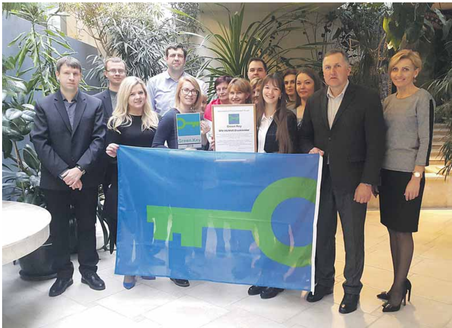
SPA Vilnius darbuotojai su „Žalio rakto“ apdovanojimu