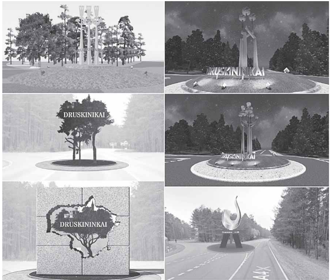
Savivaldybė pernai viešai pateikė keletą iš bendruomenės gautų Druskininkų ženklo idėjų

„Opozicija stebisi, kad kurorte nebuvo jokios diskusijos, ar tikrai verta eikvoti mokesčių mokėtojų pinigus tokiam ženklui“, - tuomet, 2017-ųjų vasarį, akcentuota minėtame www.delfi.lt straipsnyje, ironizuojant, kad prie įvažiavimo į Senąją Varėną 2014 m. iškilęs ryškiais spalvomis dažytas heraldinis bokštas, sukurtas