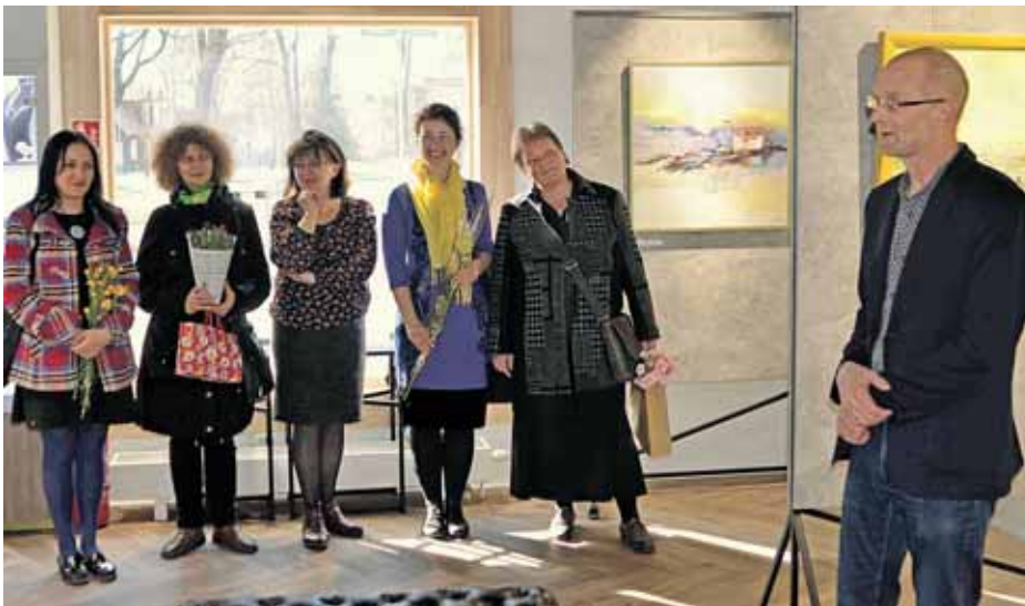
Balandžio 6-oji Druskininkų galerijoje „Studio“ (M.K.Čiurlionio g. 34)