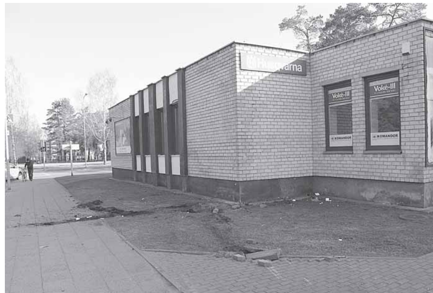
Autoįvykio vieta sekmadienio, balandžio 8-osios, paryčiais