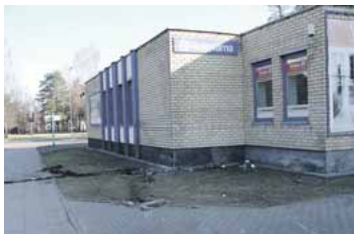
Autoįvykio vieta sekmadienio, balandžio 8-osios, paryčiais