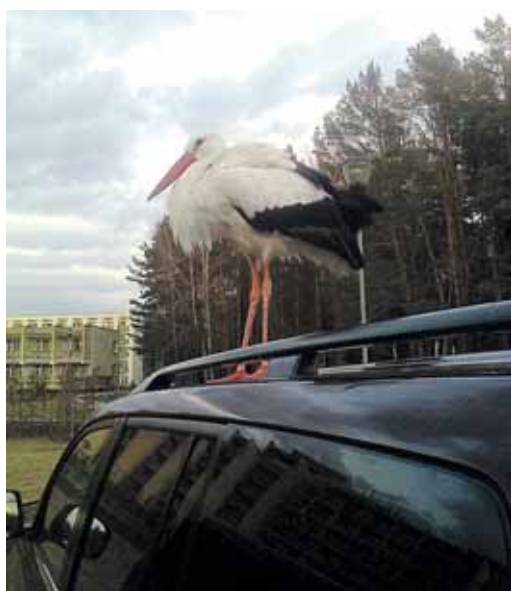
Pavasaris prie "Eglės" sanatorijos

„Mus su broliu „užkabino“ galimybė kurti, kažką nuveikti kartu“