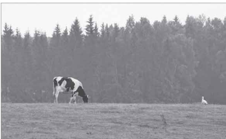
Tikimasi, kad priemonės naujovės bus naudingos ūkininkams, ypač tiems, kurie užsiima gyvulininkyste.

Europos Komisija gavo Žemės ūkio ministerijos parengtus Lietuvos kaimo plėtros 2014–2020 metų programos (KPP) pakeitimus. „Agrarinė aplinkosauga ir klimatas“ – viena iš KPP priemonių, kurioje jie numatomi.