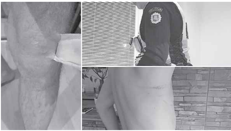
Policiją smurtu kaltinantis baltarusis įamžino savo patirtus sužalojimus

Užsienietis stebėjosi, kad pareigūnai surengė jam egzekuciją po viešbučio apsaugos kameromis.