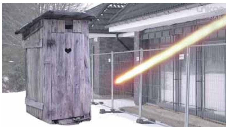
KK2 laidos stop kadrai

„Pasirodo, griauti Vijūnėlės dvaro neleidžia pati Druskininkų savivaldybė! Nes – įdėmiai paklausykite – prie Vijūnėlės negali atvažiuoti jokia statybinė technika! Nes prie dvaro labai minkštas gruntas!