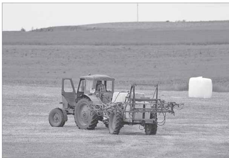
Prėmus tam tikrus pakeitimus, pretenduoti į Lietuvos kaimo plėtros 2014–2020 m. programą tapo paprasčiau, o ją įsisavinti – lengviau.

PALANKŪS PAKEITIMAI MIŠKŲ ŪKIO ATSTOVAMS Siekiant padidinti miško žemės