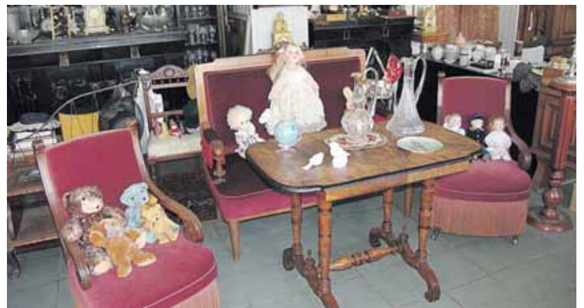
19 amžiaus pabaigos angliško salono baldai