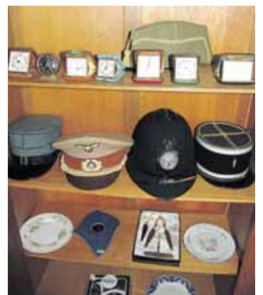
Įvairių valstybių ir laikotarpių pareigūnų kepurės