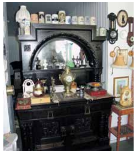
Klasikinė svetainės indauja iš Hamburgo regiono