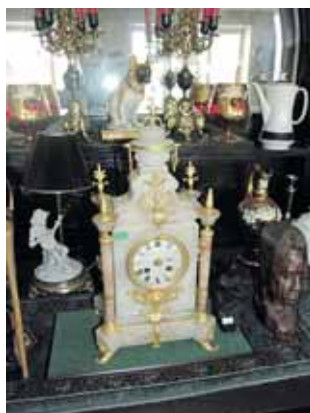
19 a. pradžios prancūziškas laikrodis iš alebastro