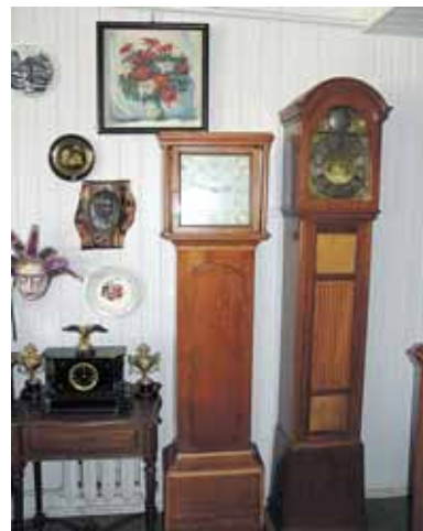
Angliškas 18 šimtmečio (kairėje) ir daniškas 1901 metų laikrodžiai