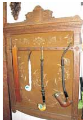
Danų jūreivių pypkės (19 a.)