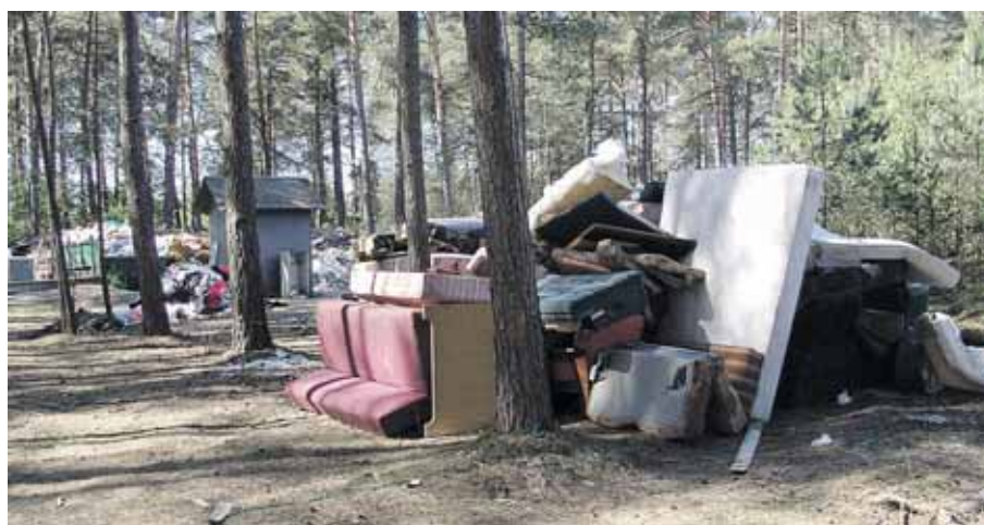
Antrinių žaliavų surinkimo aikštelėje Nervuose, Gojaus gatvėje