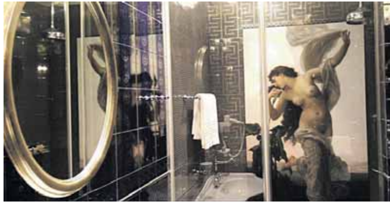
„Dviračio“ peliukai laidoje priminė garsiojo spa kambario grožybes