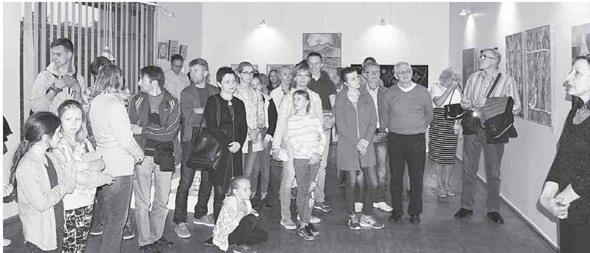
Druskininkų M. K. Čiurlionio meno mokyklos V. K. Jonyno dailės skyriaus diplomantų baigiamųjų darbų parodos „Jaunieji druskininkiečiai kuria '18“ atidarymas