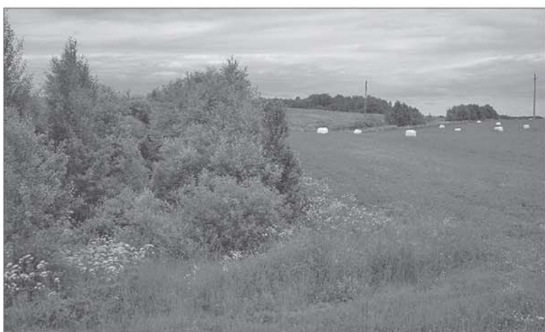
Nederlingose žemėse ūkininkaujantys žemdirbiai gali gauti paramą, skiriamą už kiekvieną žemės ūkio paskirties žemės hektarą.

Anot specialistės, esminis dalykas yra tas, kad nuo 2018 m. naudojamas naujas žemėlapis, o jo pagrindu remiamos vietovės, kuriose esama gamtinių arba specifinių kliūčių. R. Motiejaitės teigimu, žemėlapis buvo parengtas vadovaujantis Europos Komisijos patvirtinta išskyrimo tvarka, privaloma visoms šalims narėms. Pašnekovė pabrėžė, kad 2018 m. paraiškų priėmimas vyksta pagal šią žemėlapyje nustatytą naują gamtinių ar kitų specifinių kliūčių vietovių ribas. Kai kurios seniūnijos (168), pasak specialistės, to nepajus, bet 69 seniūnijos, kurių bendras žemės ūkio paskirties plotas sudaro apie 500 tūkst. ha, pajus ribų pasikeitimą. Šios seniūnijos neatitiko vietovių, kuriose esama didelių gamtinių kliūčių, išskyrimo sąlygose nurodytų reikalavimų ir todėl nepateko į naują žemėlapi, taip pat netek-