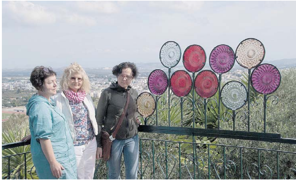
Graikijoje balkonai puošiami gėlėmis iš stiklo

prieinama nė viena paroda, anei muziejus. Druskininkai skendėjo siaubingame triukšme ir dulkėse. Tiesiog antrieji Gariūnai.