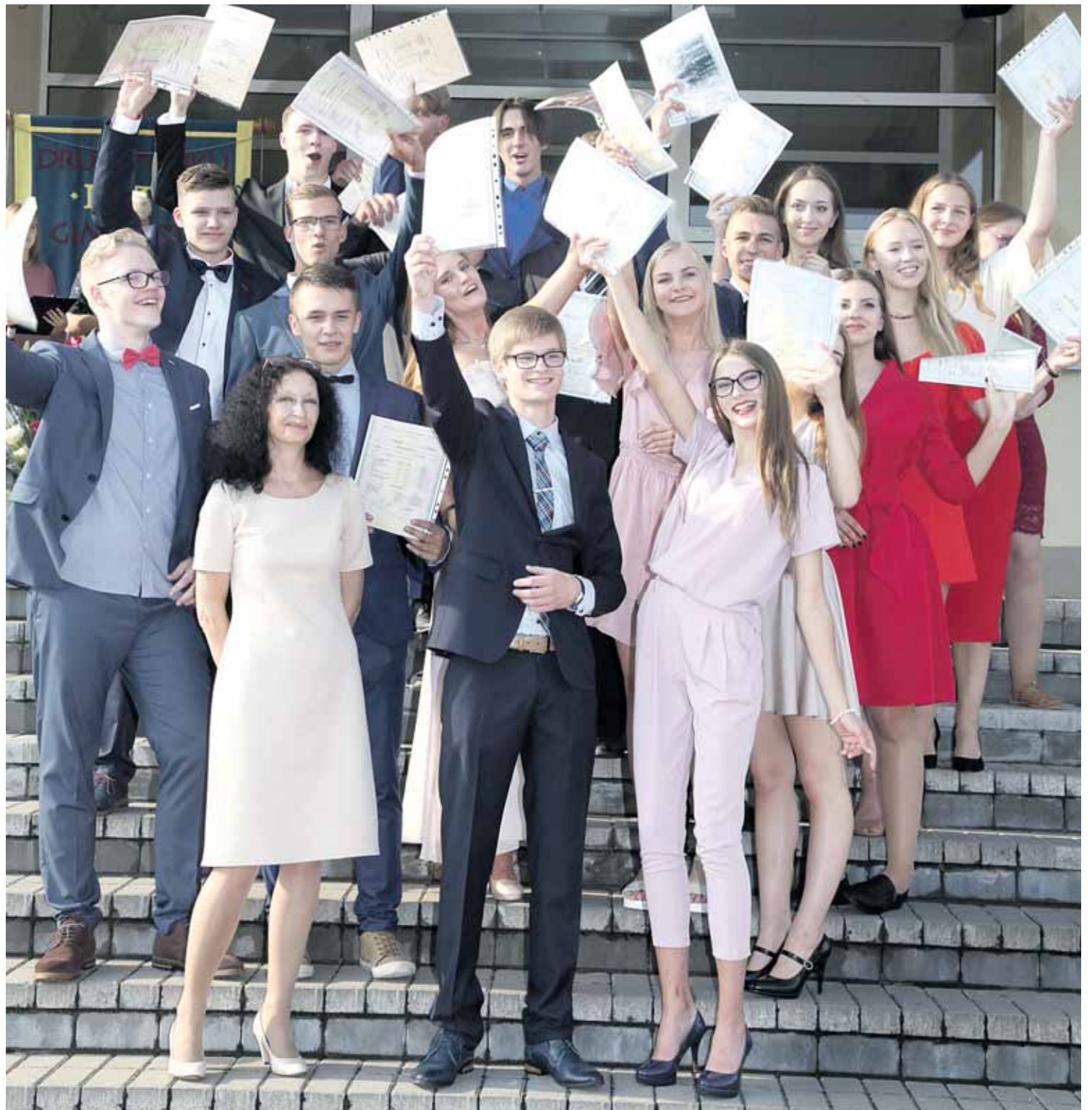
Šiais metais „Ryto“ gimnaziją baigė 147 abiturientai