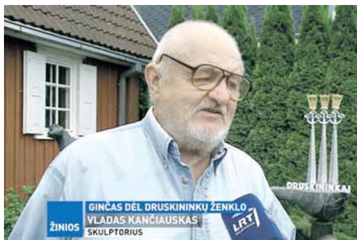
LRT laidos "Panorama" stop kadras

Druskininkų valdžiai LATGA išsiuntė pretenziją dėl naujo Druskininkų ženklo