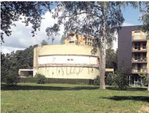
Buvusi „Nemuno“ sanatorijos koncert sal

Druskinink vald ia ię „Skirnuvos“ nes kmingai band prisiteisti beveik 2 mln. eur