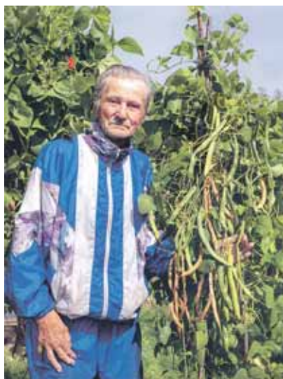
A.Zdanavi iaus ięaugintos aliosios ęparagin s pupel s – gerokai didesn s nei prastos geltonomis ankętimis

Ne prast ęparagi- ni pupeli plan- tacija Leipalingyje