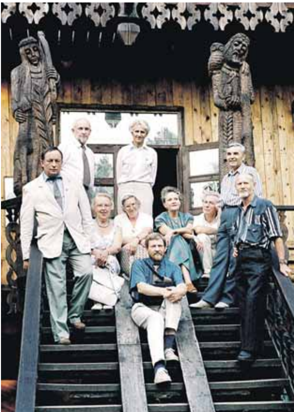
Druskinink s j die iai