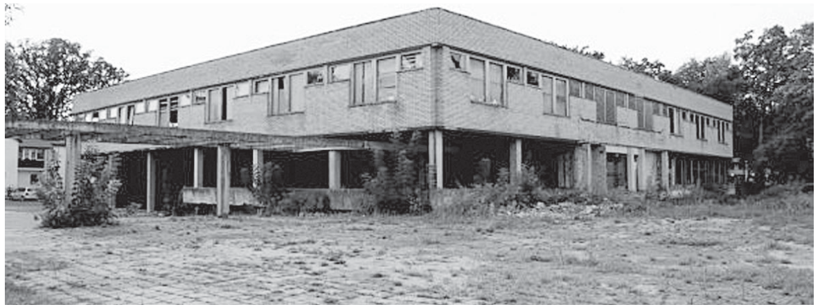
Apleisti „Nemuno“ sanatorijos pastatai