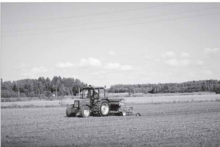
Kol vieni ūkininkai laukia paraiškų vertinimo rezultatų, kiti, teikę dokumentus ankstesniuose paraiškų priėmimo etapuose, jau džiaugiasi paramos teikiama nauda.

Svarbu pažymėti, kad prioritetinės eilės sudarymas įtakos paramos skyrimui ar neskyrimui neturės, nes bendra paraiškose prašoma paramos suma neviršija skirtosios. KPP priemonės „Bendradarbia-