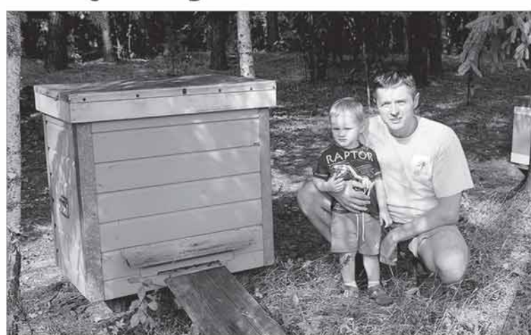
Is Airijos grįžęs vilnietis ryžosi kaime laikyti bites.

Šiais laikais ne tik europiečiai, bet ir lietuviai tampa vis sąmoningesni ir puoselėja bei tausoja ne tik savo sveikatą, bet ir aplinką. Būtent todėl vis populiarėja ekologiška ir kokybiška produkcija, užauginta ekologiniuose ūkiuose ar tiesiog pagaminta laikantis griežtų kokybės reikalavimų. Tokie žemės ūkio produktai išauginti rūpinantis aplinka, nenaudojant cheminių trąšų ir sintetinių pesticidų, o ekologiniuose ūkiuose dirbantys žmonės nėra veikiami chemikalų. Dėl didėjančios tokių produktų paklausos vis daugiau šalies žemdirbių apsisprendžia ūkininkauti ekologiškai.