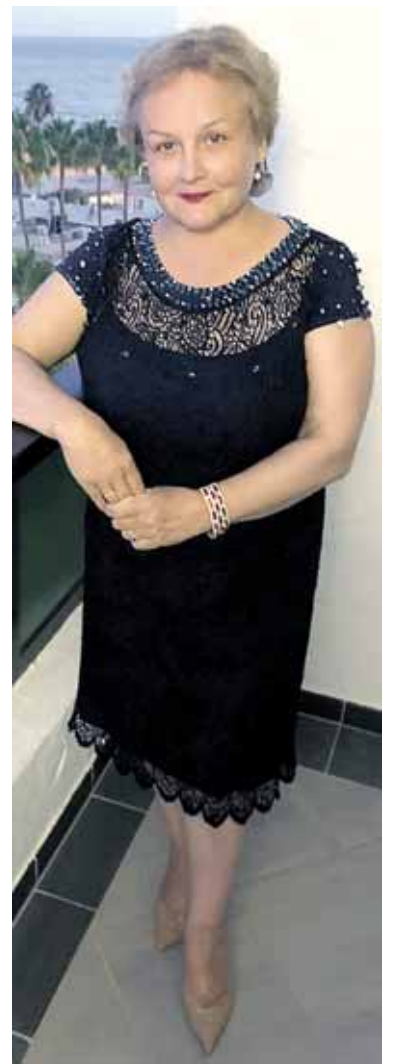
EP narė dr. Laima Andrikienė

Apklausoje dalyvavusių žmonių optimizmas ir parama gilesnei ES integracijai man yra suprantama. Aš taip pat manau, kad didesnė integracija neišvengiama, norint netik geresnio gyvenimo visiems ES piliečiams, bet ir siekiant, kad ES taptų dar rimtesne žaidėja pasaulio politikoje. ES negali sau leisti kalbėti skirtingais balsais ir reikšti tuo pačiu klausimu skirtingas nuomones, vienas – savo šalių viduje, kitas – Briuselyje, o trečias – nuvykus į Maskvą, Vašingtoną ar Pekiną. Pasaulio geopolitinė padėtis reikalauja, kad ES būtų kumštis, o ne palaida bala ar nesibaigiančių diskusijų klubas. Juk Rusija nerimsta, siekdama didesnės įtakos visame pasaulyje, auga Kinijos ekonominė galia ir politinės ambicijos dominuoti pasaulyje. O JAV politika, prezidentu tapus D. Trumpui, dažnai yra sunkiai nuspėjama. Šioje situacijoje toks elgesys kaip Vengrijos premjero V. Orbano, kai tą pačią savaitę paniekinamai el-