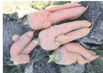
Figūringos morkos iš Mažonių kaimo