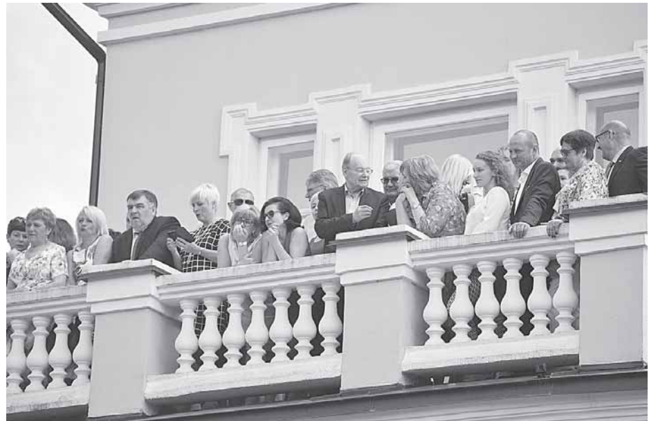
Kurorto šventės metu vykusiai vakarienei gegužės 25 d. vietinė valdžia išleido beveik 12 tūkst. eurų. Pagal sutartį paslaugos buvo suteiktos miesto muziejuje

K aip paaiškėjo, peržiūrėjus Viešųjų pirkimų informacinėje sistemoje skelbiamus pirkimus, Druskininkų valdžia gegužės 25 d. Kurorto šventės vakarienei išleido tiesiog stulbinamą sumą - beveik 12 tūkst. eurų. Žinoma, ne savų, o mūsų, mokesčių mokėtojų, pinigų. Ką tokio, sakykit, reikia suvalgyti ir išgerti už šitokius pinigus?