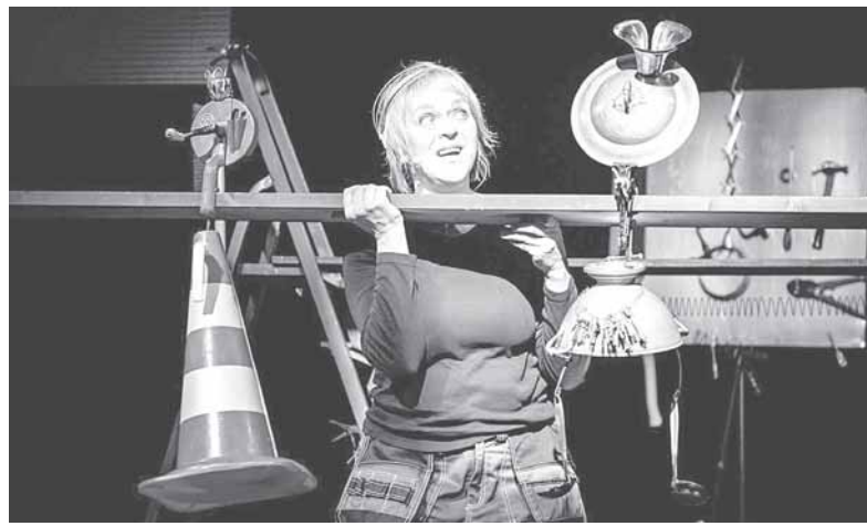
Stalo teatro spektaklis