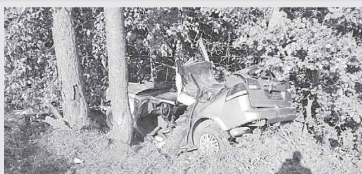
Autoavarija rugsėjo 21 d. prie Perlojos, kur žuvo 18-metis druskininkietis

Nacionalinio maisto ir veterinarijos rizikos vertinimo institutas įvertino riziką naminiams paukščiams užsikrėsti Europoje plintančiu didelio patogeniškumo paukščių gripu. Mokslininkų manymu, šios ligos rizika Lietuvai kol kas nėra didelė, – pavasarinės paukščių migracijos metu nebuvo užregistruotas nė vienas atvejis.