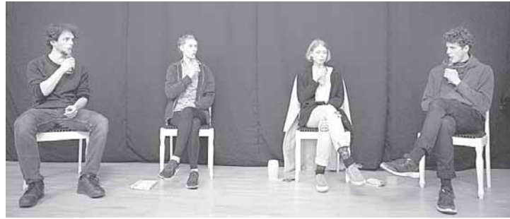
Iš spektaklio „Iliuzijos“