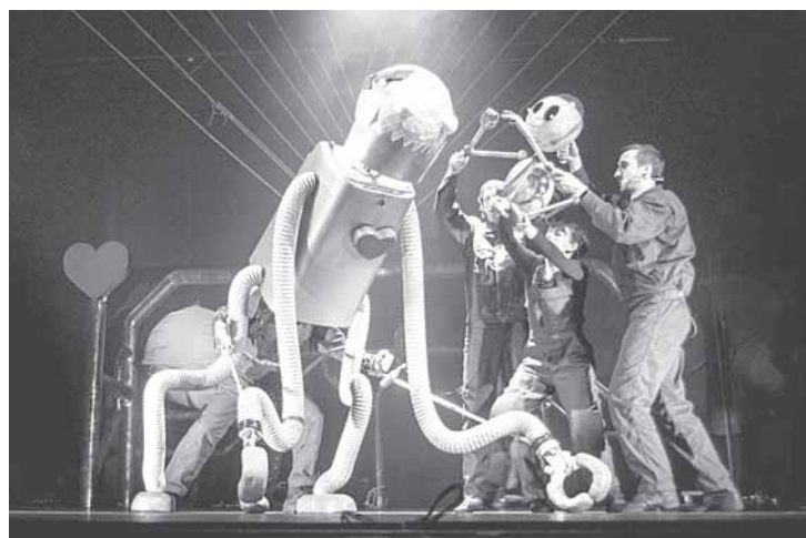
Iš spektaklio „Pinokis“