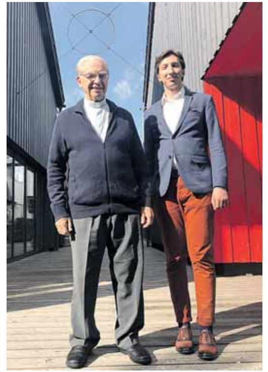
Su kardinolu A. J. Bačkiumi