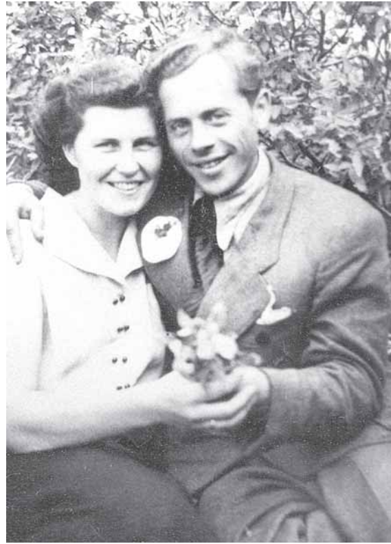
Savo vestuvių dieną 1955 m. Vorkutoje