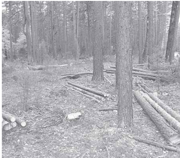
Iškirsti medžiai Ligoninės ir M.K. Čiurlionio gatvėse