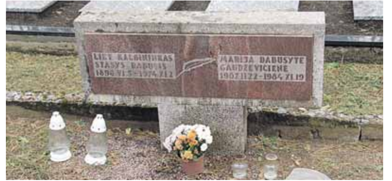
Žinomo kalbininko Stasio Dabušio kapas