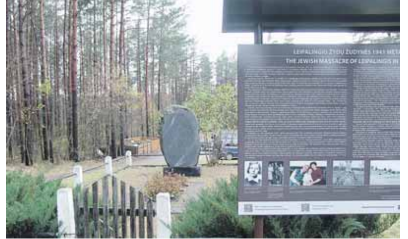
Šiomet pastatytas informacinis stendas nužudytiems Leipalingio žydams atminti