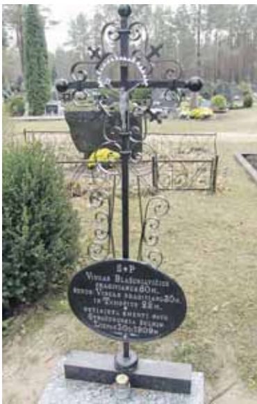
Atnaujinti senieji antkapiniai paminklai Leipalingio kapinėse

Leipalingio žydai. Paminklinėje plokštėje kapinių centrinėje dalyje įamžintos žuvusiųjų partizanų pavardės.