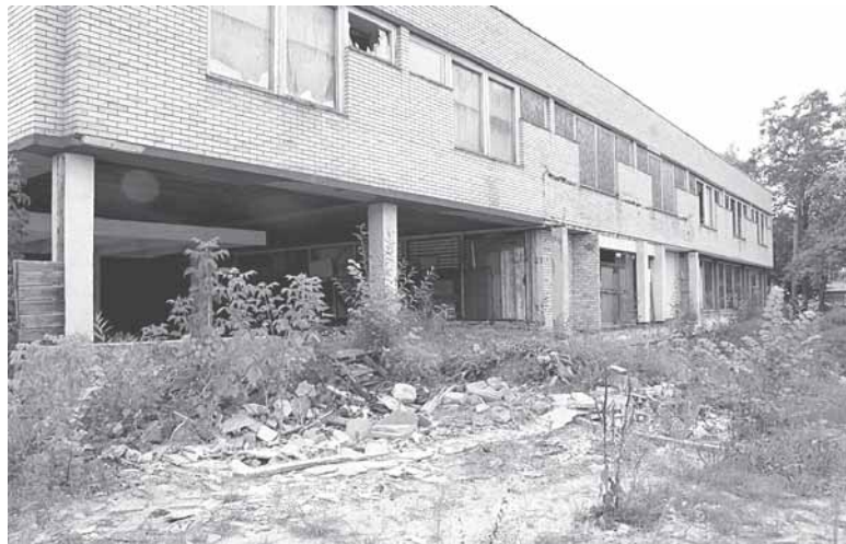
Vietos valdžia pastebi krislą kitų akyse, tačiau savo kieme gulinčio rąsto nemato – liudija savivaldybei priklausančio turto – buvusios „Nemuno“ sanatorijos griuvėnių ir „Druskonio“ medinuko Vilniaus al. 32 palyginimas