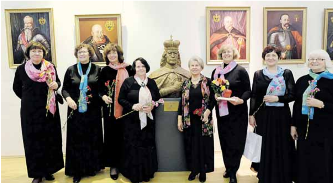
Druskininkų TAU moterų vokalinis ansamblis „Vakarėjant“

nininkėmis (dėl tam tikrų priežasčių važiavo ne visos ansamblių lankančios) ir juos lydinčia nedidele palaikymo komanda išriedėjo iš miesto Vilniaus link, kai kurioms ansamblio dalyvėms jau parūpo, kaip seksis, nors jos scenoje buvusios daugiau nei dvidešimt kartų. Vadovė sudraudė, kad neverta drebtinti balso stygų važiuojant. Be to, buvo numatytas repeticijos laikas festivalio scenoje. Atvykusias pasitiko Vilniaus TAU atstovės, kurios rūpinosi, kad dalyviai turėtų kampa persirengti, pasidėti daiktus, vaišino kava, siulė vandens, lydėjo į salę, padėjo susirasti ansambliui paskirtas vietas, aprūpino programos lankstinukais. O ansambliciai ar chorų dalyviai repetavo,