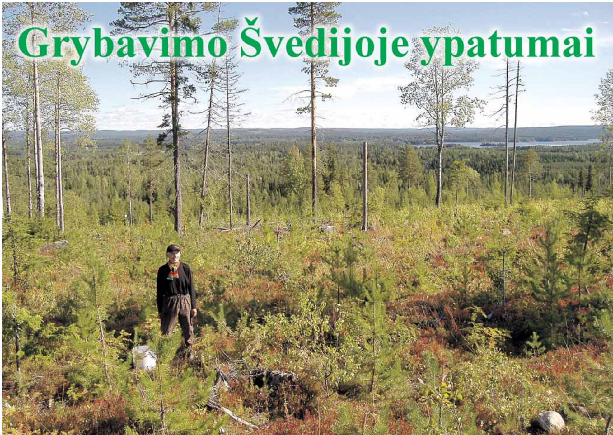
Druskininkietis Sigitas Padegimas Švedijoje šį rudenį grybavo, o vasarą uogavo