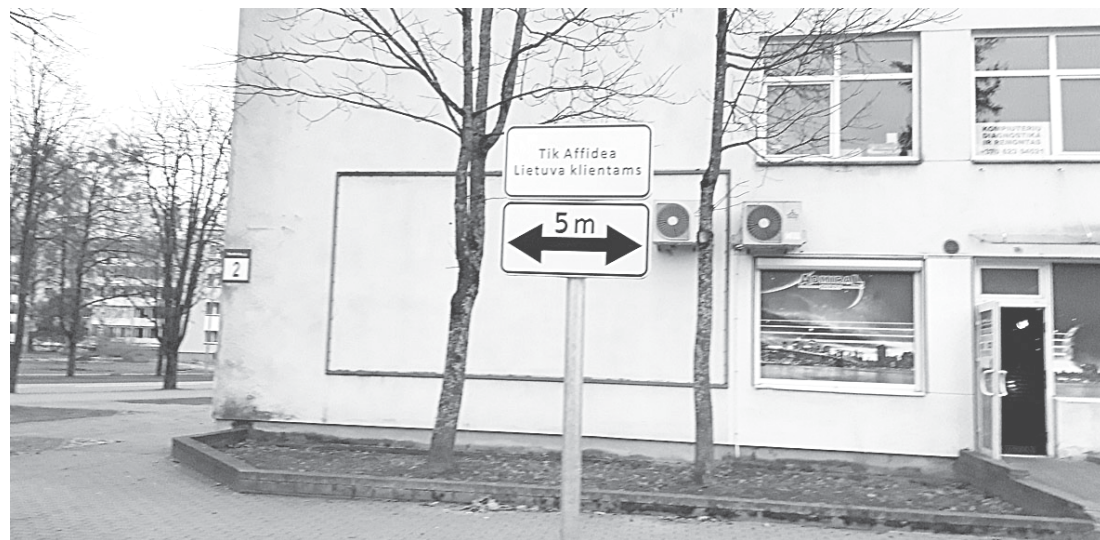
Kelio ženklas prie Druskininkų ir M.K.Čiurlionio gatvių sankryžos