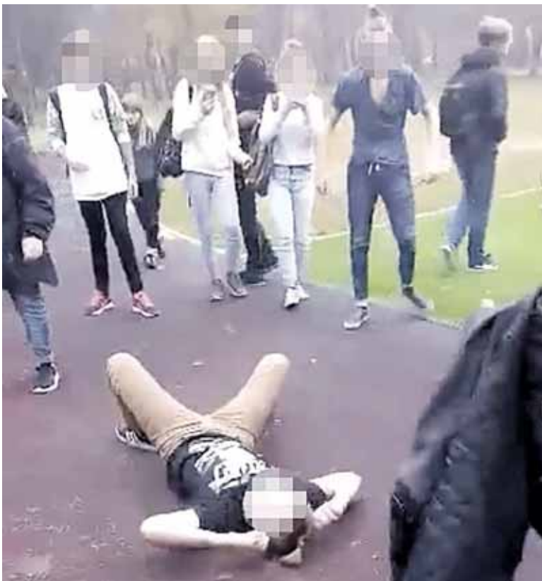
Muštynės Druskininkų mokykloje

„Iš filmuotos medžiagos matyti, kad viskas įvyko mokyklos teritorijoje. Daugybė jaunų žmonių fil-