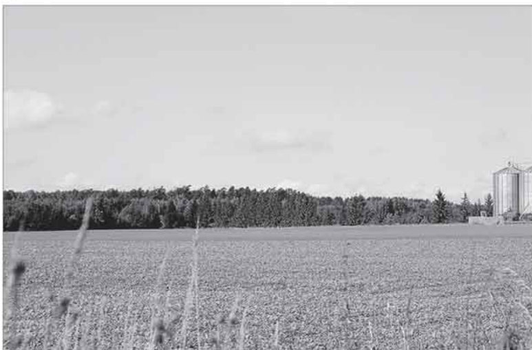
KPP veiklos sritis „Parama EIP veiklos grupėms kurti ir jų veiklai vystyti“ vienija ūkininkus, konsultantus ir mokslininkus.

EIP veiklos grupių tikslas – taikant žinias ir inovacijas plėtoti konkurencingą ir tvarų žemės bei miškų ūkį. Veiklos grupė turi sudaryti ne mažiau kaip 3 subjektai: fiziniai ir (ar) juridiniai asmenys, užsiimančys žemės ūkio ir (ar) miškų ūkio veikla; juridiniai asmenys, vykdančys mokslo ir (arba) studijų veiklą; konsultavimo institucijos, užsiimančios fizinių ir (ar) juridinių asmenų, užsiimančių žemės ūkio ir (ar) miškų ūkio veikla, konsultavimu. EIP veiklos grupės veikloje taip pat gali dalyvauti kiti juridiniai asmenys – kaimo plėtros dalyviai (gamintojus vienijančios orga-