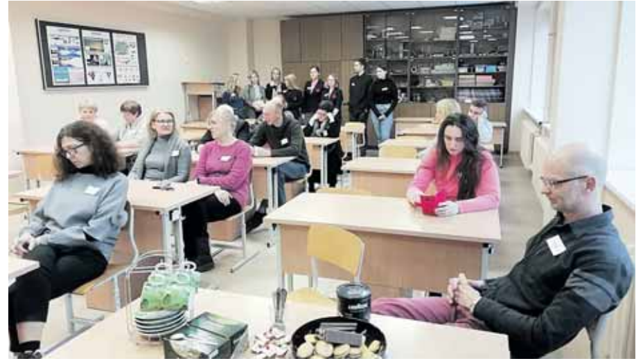
Mokytojų streiko Druskininkų „Ryto“ gimnazijoje dienomis

Šių metų lapkričio 22 dieną Druskininkų „Ryto“ gimnazijos darbuotojų profesinė sąjunga nusprendė prisijungti prie Lietuvos švietimo darbuotojų profesinės sąjungos paskelbto neterminuoto streiko, nes esantys LŠDPS nariai.