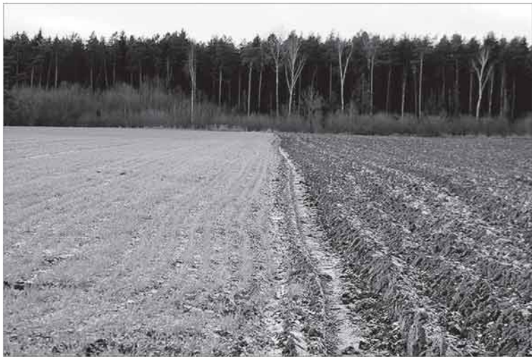
Pasėlius ir augalus nuo rizikų, susijusių su meteorologiniais reiškiniais, 2017 m. draudė 671 ūkis. Apdraustas plotas siekė 201 tūkst. ha.

siekė 201 tūkst. ha, iš viso apdrausta apie 10 proc. visos ariamosios žemės deklaruoto ploto. Kompensacijoms išmokėta apie 2,9 mln. Eur.