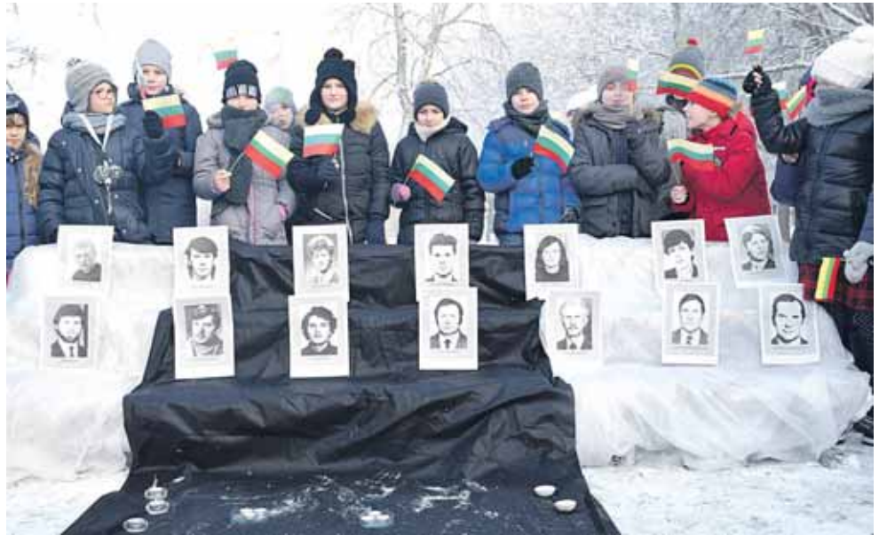
Renginys, skirtas laisvės gynėjams paminėti, „Atgimimo“ mokyklos kieme