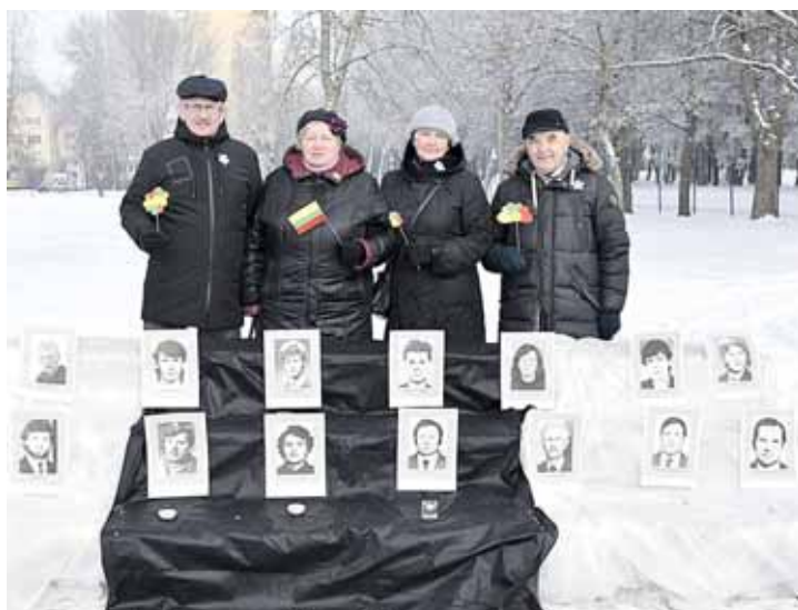
„Bičiuliai“ renginyje, skirtame laisvės gynėjams paminėti, „Atgimimo“ mokyklos kieme

Atmintis jungia praeitį su dabartimi ir ateitimi