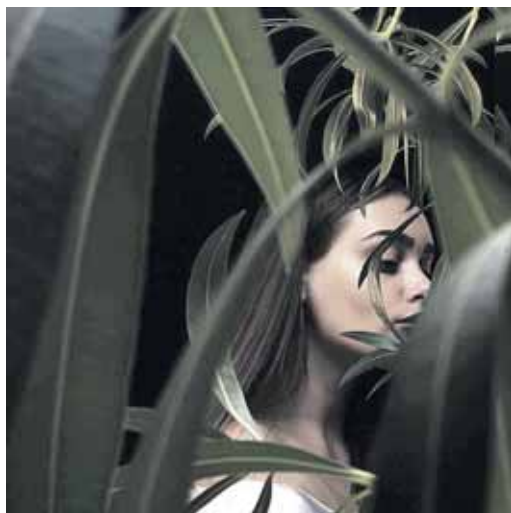
Smiltės Šeimytės meninė fotografija