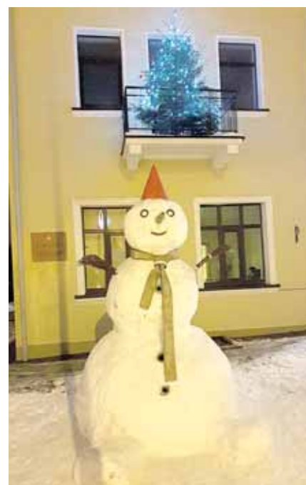
Druskininkų ugniagesių gelbėtojų sniego senis